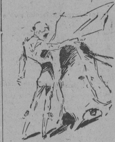
Ortega en un pase por alto