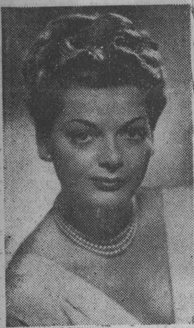
Lys Assia, una de las primeras figuras que Soler Serrano ha captado para "Conectamos con Brasil", actual éxito del teatro Talía