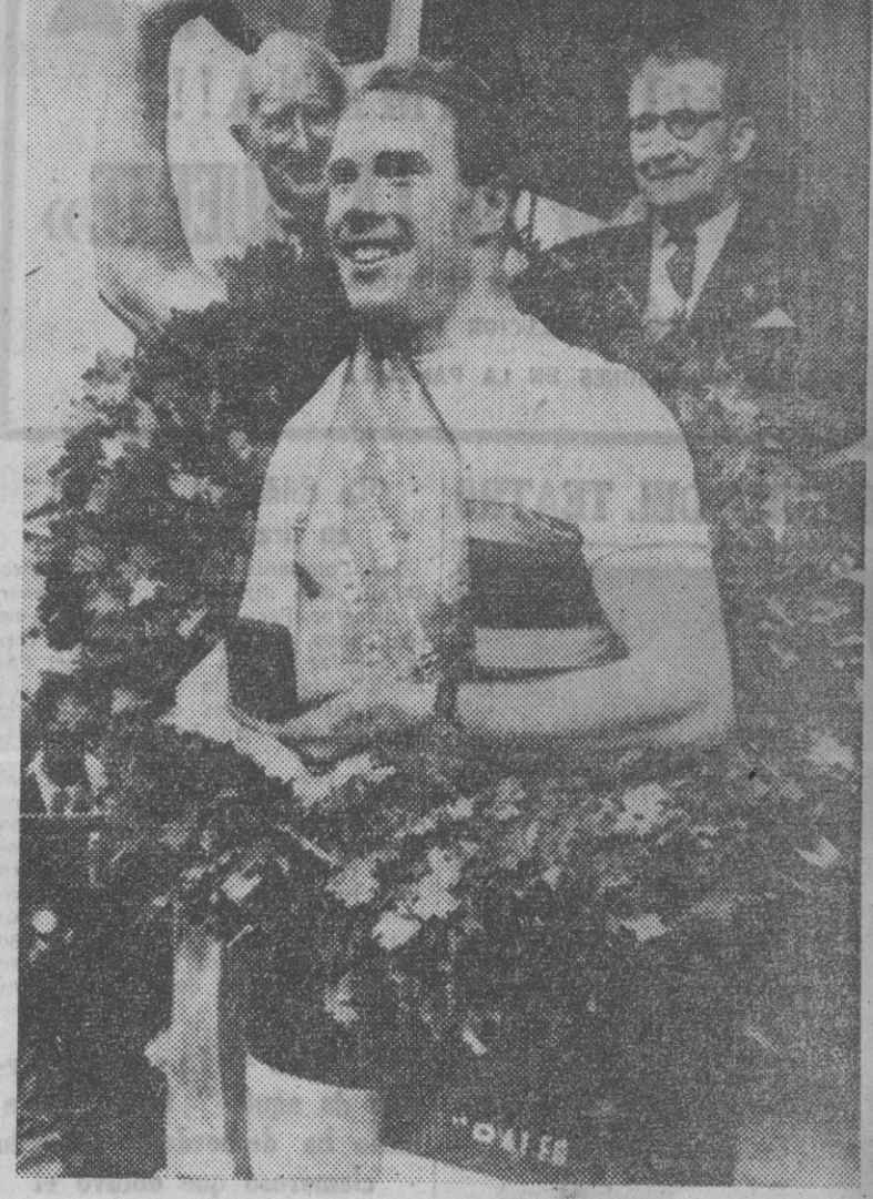
Rog Harris, ciclista inglés que ha ganado el título mundial de pista para profesionales en los Campeonatos mundiales de Ciclismo celebrados en Copenhague.