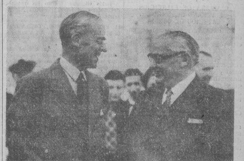
Sir Stafford Cripps y Mr. Bevin a bordo del "Mauritania", antes de partir de este puerto rumbo a Washington, donde tomarán parte en las conversaciones sobre el dólar, cambian impresiones que, por las sonrisas, deben ser optimistas.