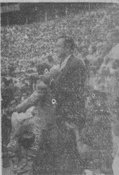
George Sanders, el gran actor de la cinematografía norteamericana, que actualmente está en nuestra ciudad, acudió ayer, a la Plaza de Toros, para presenciar la corrida. He aquí a George Sanders aplaudiendo sonriente la faena de uno de los diestros.