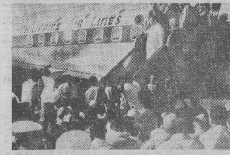
El presidente Quirino desciende del avión con el que ha regresado a Filipinas, después de permanecer una temporada en los Estados Unidos