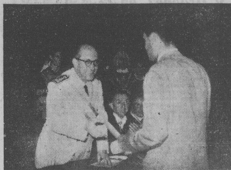
El ministro de Educación Nacional, señor Ibañez Martín, entrega un diploma a uno de los alumnos que han asistido a los cursos de verano celebrados en la Universidad Internacional de Santander