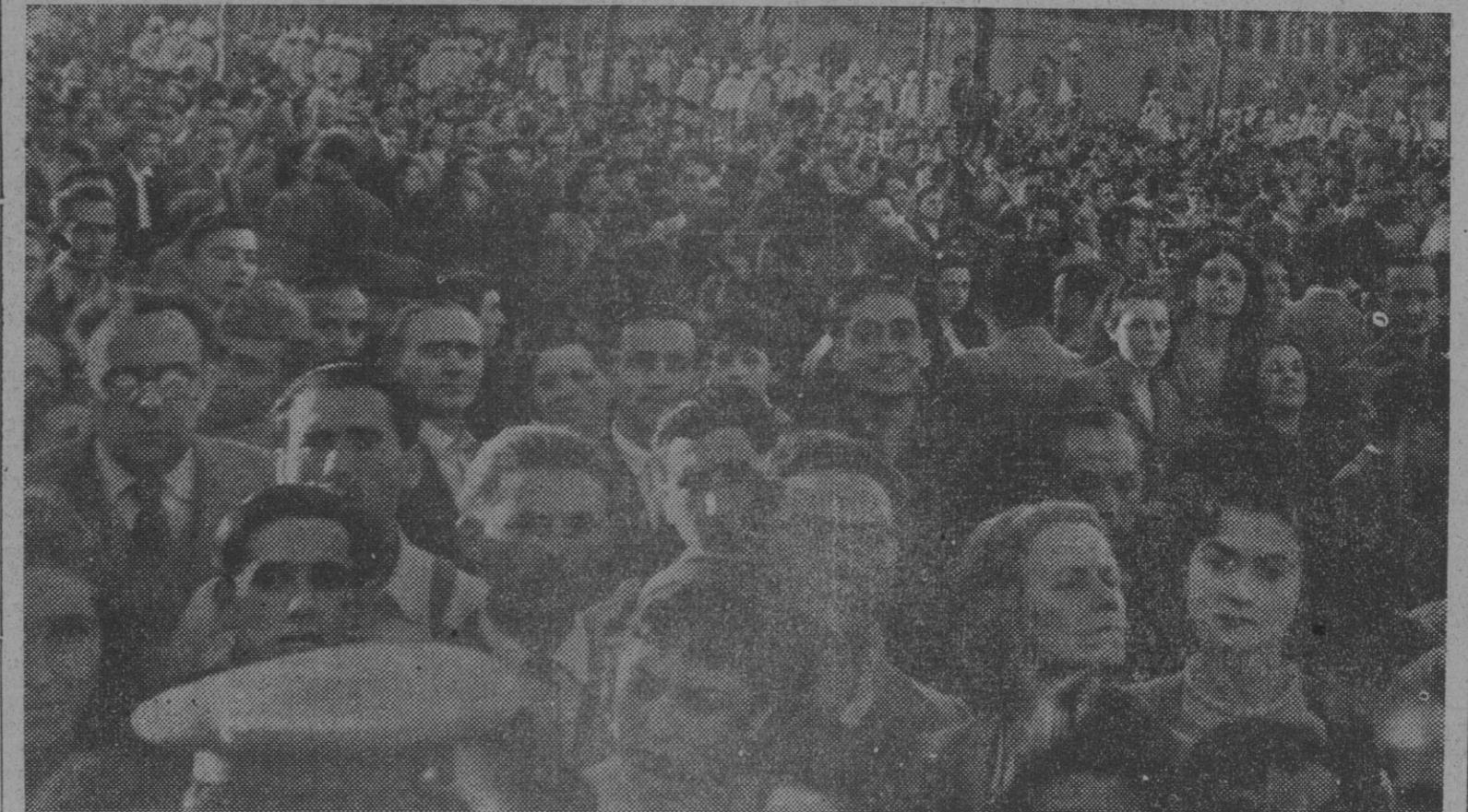
La multitud aguardando en la Puerta de la Paz, la llegada de S. E. el Jefe del Estado.

HANGELLO (Holanda), 1. — El ex campeón mundial de ajedrez, Max Euwe, se ha salvado milagrosamente de la muerte en un accidente automovilístico ocurrido entre Hamburgo y Bremen. — Alfil.