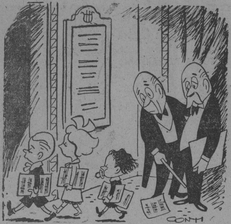
—Fíjate. Me está dando vergüenza ser director de orquesta a mis años.