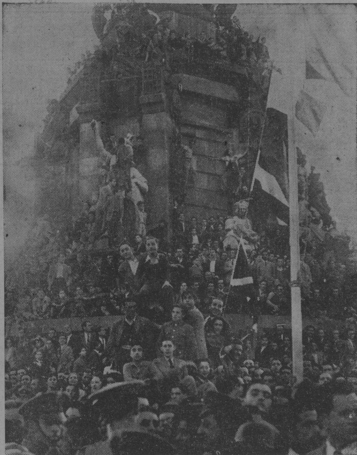
Un impresionante aspecto del monumento a Colón durante la tarde de ayer, en que el pueblo de Barcelona acudió a recibir al Caudillo