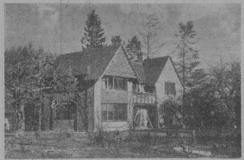
El primer ministro británico laborista va a comprar esta casa de seis dormitorios en Prestwood, cerca de Great Missenden, en el condado de Buckingham. El precio pedido por su actual dueño se cree es de 9.500 libras esterlinas.

Thorp hablará sobre el programa Truman de ayuda a los países atrasados