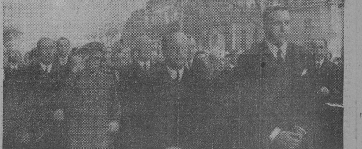
Una grandiosa manifestación de duelo ha constituido en Madrid el entierro del decano de los periodistas españoles, marqués de Valdeiglesias, a la que se asoció el Gobierno, llevando su representación oficial en la presidencia del acto los ministros de Asuntos Exteriores y Justicia, asistiendo además numerosas personalidades madrileñas y una innumerable multitud de todas las clases sociales.