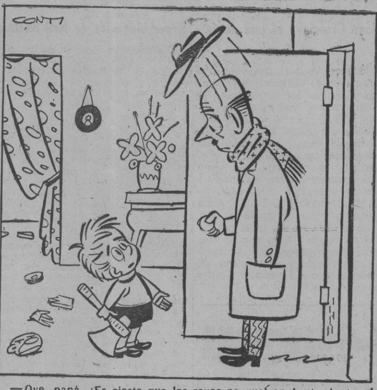
—Oye, papá, ¿es cierto que los reyes no vuelven hasta dentro de un año? Es que ya he terminado los juguetes.

EN TODOS LOS HOGARES DE FRANCIA HAY UN ENFERMO DE GRIPE