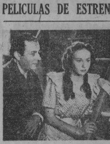
Una escena de la "Pimpelela blanca", protagonizada por Carlo Ninchi, Carlo Campanini y la gentil Mirella Monti...