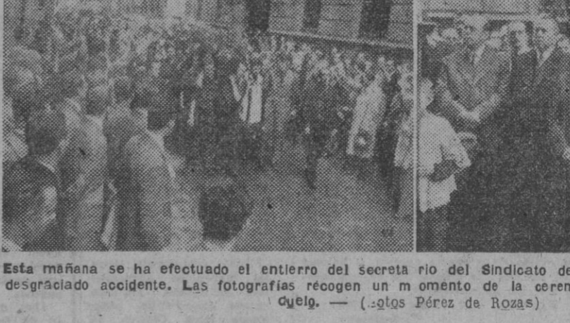
Esta mañana se ha efectuado el entierro del secretario del Sindicato del Metal, fallecido víctima de un desgraciado accidente. Las fotografías recogen un momento de la ceremonia y la presidencia oficial del duelo.