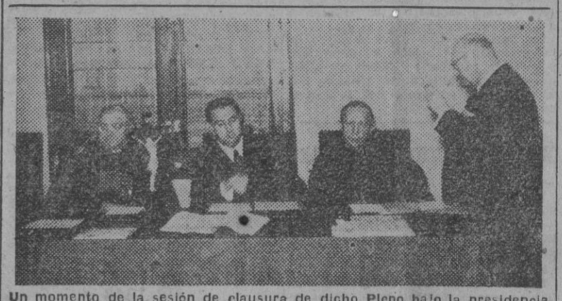
Un momento de la sesión de clausura de dicho Pleno bajo la presidencia del ministro de Asuntos Exteriores, acompañado del funcionario de S. S. y otras personalidades.