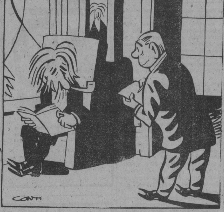
— Profesor: ¿Hace tiempo que trabajaba en el rayo de la muerte? — No, no. Se me ocurrió viendo una de esas películas en jornadas.