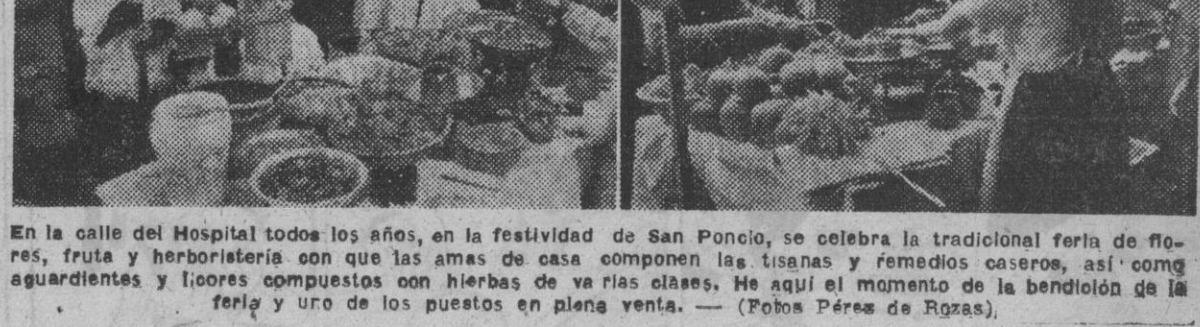
En la calle del Hospital todos los años, en la festividad de San Poncio, se celebra la tradicional feria de flores, fruta y herboristería con las amas de casa componen las tisanas y remedios caseros, así como aguardientes y licorosos compuestos con hierbas de varias clases. He aquí el momento de la bendición de la feria y uno de los puestos en plena venta. — (Pobos Pérez de Rozas).