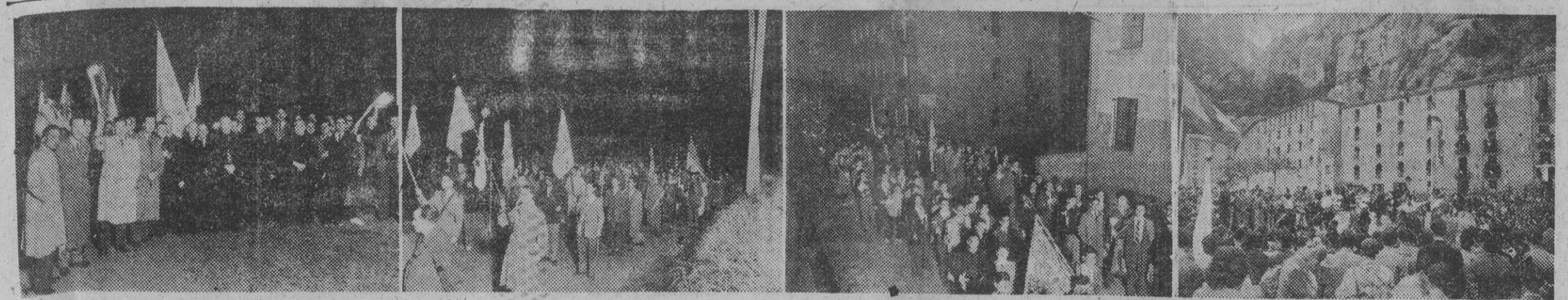
En magna peregrinación, las Juntas Diocesanas de Jóvenes de todas las Diócesis se concentraron ayer, en número de 12.000, en Montserrat, para subir a pie la Santa Montaña, saliendo a la una de la madrugada de la citada población llegando a Montserrat a las cinco, para postrarse a los pies de la Virgen. El obispo de Barcelona presidió tan importante manifestación de fe. He aquí algunos aspectos de la salida y del festival folclórico celebrado en Montserrat.