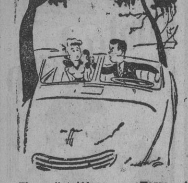
El radiotelefono. — ¡Toma, tu madre que vuelve a llamarte!