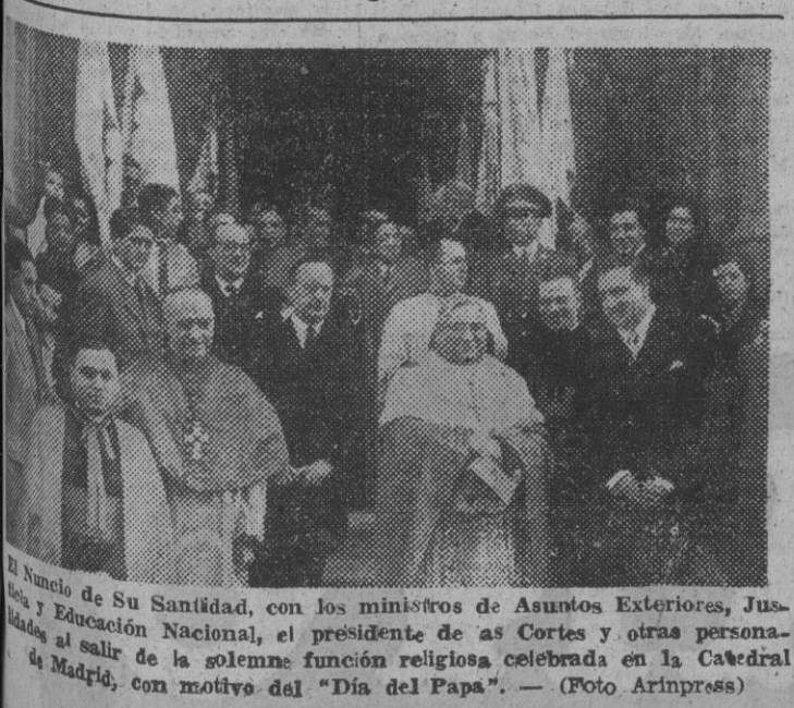
El Venerable de Su Santidad, con los ministros de Asuntos Exteriores, Justicia y Educación Nacional, el presidente de las Cortes y otras personalidades al salir de la solemne función religiosa celebrada en la Catedral de Madrid, con motivo del "Día del Papa".