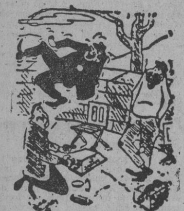
— ¡En mi vida he tenido un cliente con tantas osquillas!