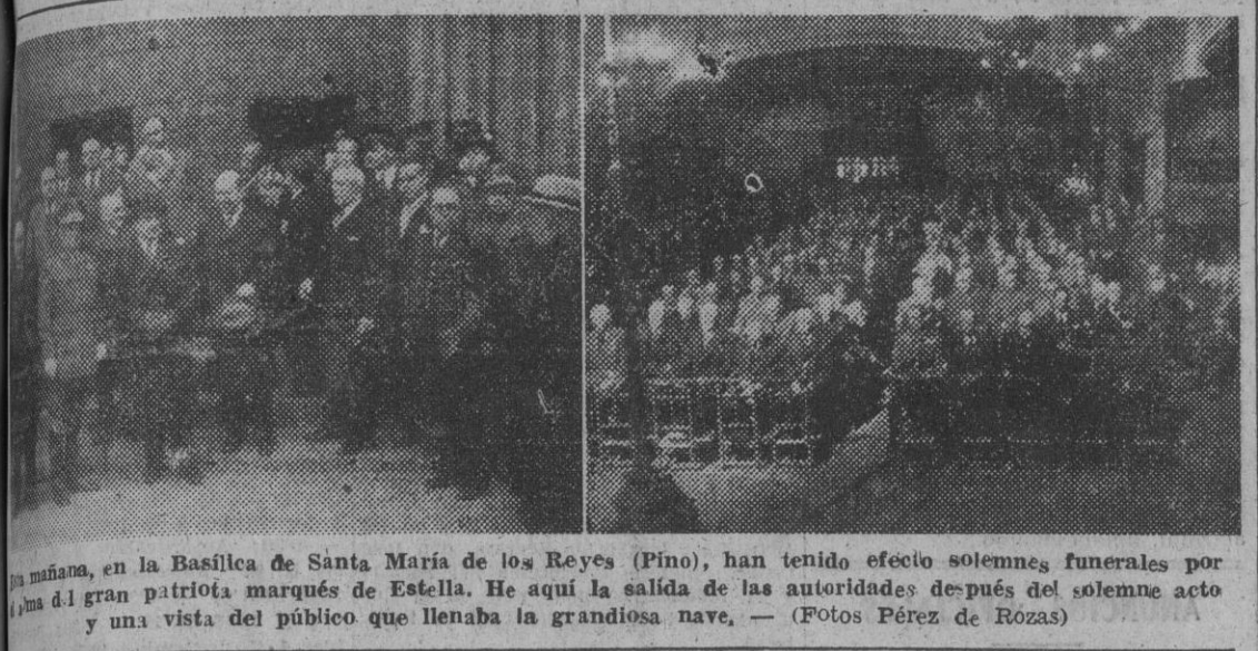
Mañana, en la Basílica de Santa María de los Reyes (Pino), han tenido efecto solemnes funerales por el alma del gran patriota marqués de Estella. He aquí la salida de las autoridades después del solemne acto y una vista del público que llenaba la grandiosa nave.