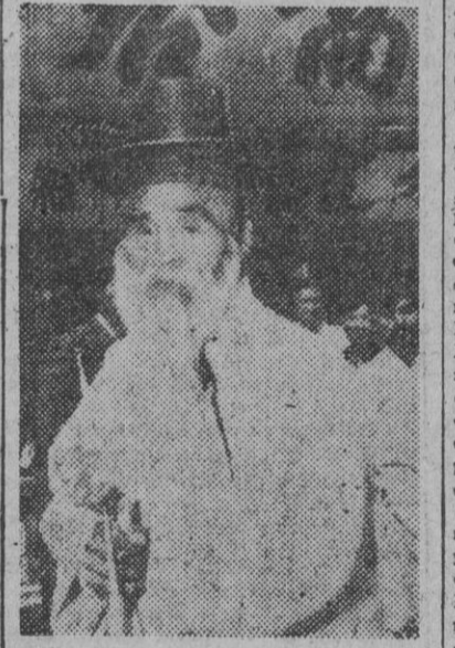
Este anolano coreano es miembro de los “yangbans”, a los que se ve paseando por las calles de Seul. Son ancianos que han adquirido gran sabiduría y son respetados por sus conciudadanos. Se distinguen por sus altos sombreros, fabricados de crin de caballo y sujetos por una cinta al cuello.