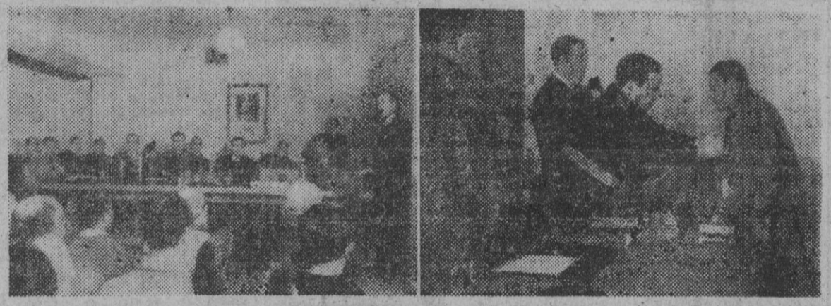
Dos momentos del acto conmemorativo del XL aniversario de la creación del Instituto Nacional de Previsión, celebrado en San Juan Despi, que ha tenido, además, el carácter de homenaje al fundador de la Obra, señor Maluquer.

El Gobierno de Helsinki, reunido con el jefe del Estado para estudiar la petición soviética