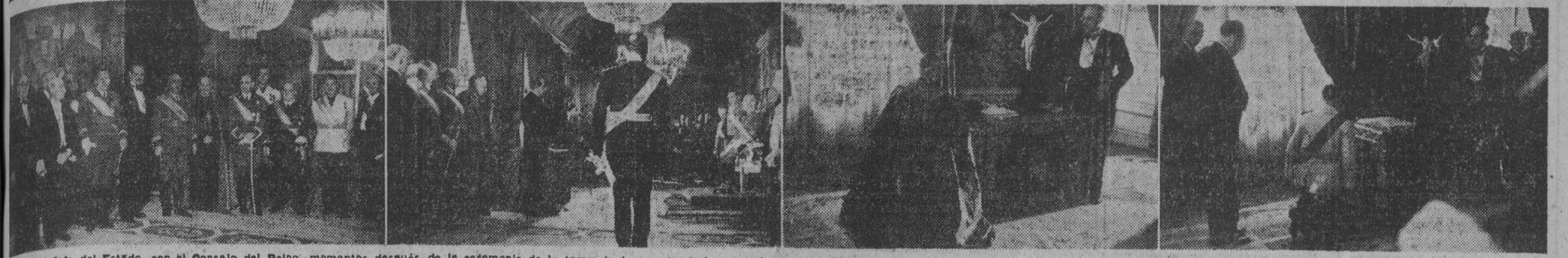
1. S. E. el jefe del Estado, con el Consejo del Reino, momentos después de la ceremonia de la toma de juramento de los consejeros en el Salón de Consejos del Palacio de El Pardo. — 2. El presidente del Consejo del Reino, don Esteban Bilbao, expone al presidente los trámites seguidos y que justifican las designaciones recaídas en los consejeros presentes, momentos antes de la ceremonia de la jur. — 3 y 4. El obispo de Madrid-Alcalá y don Fermín Banz Orrio, respectivamente, en el momento de prestar su juramento.