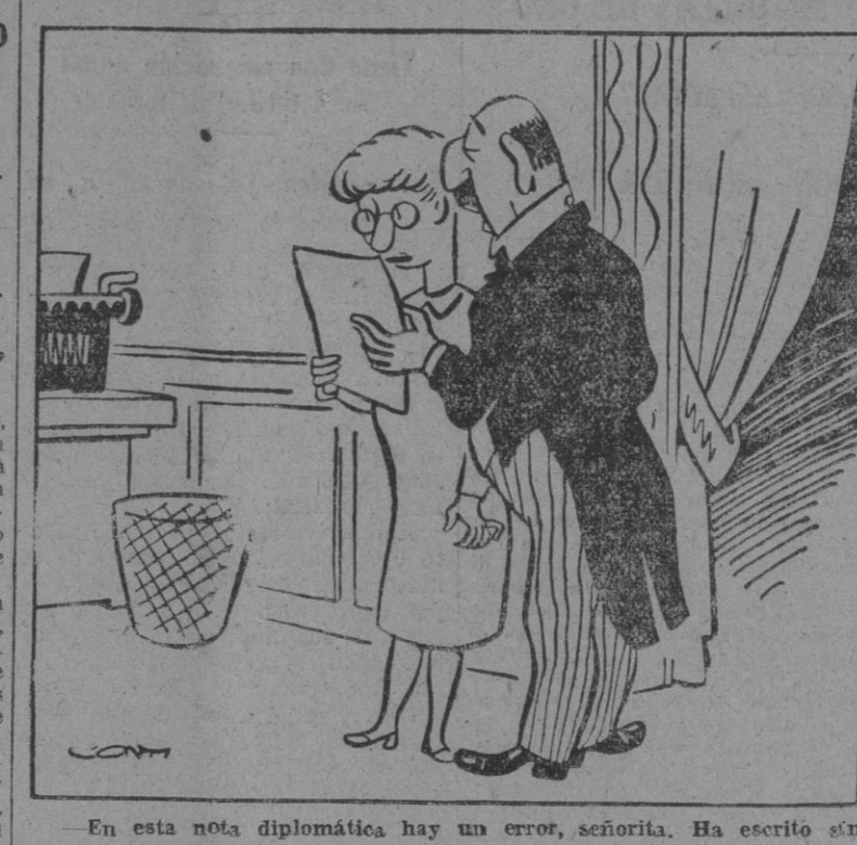
En esta nota diplomática hay un error, señorita. Ha escrito sin vergüenzas con he ain.