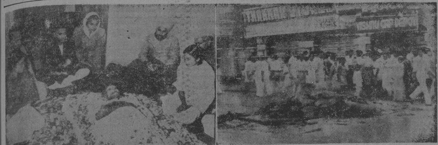
I. Los miembros de la familia de Gandhi velan el cadáver del mahatma en su residencia de Birla House. Como puede apreciarse en la fotografía cubierto de flores el cuerpo del padre de la independencia india. Las dos muchachas sentadas a derecha e izquierda son sus nietas Ava y Manu Gandhi. — II. Pocas horas después de conocerse la noticia del asesinato de Gandhi se produjeron ya graves disturbios en algunos barrios de Bombay. En la foto vemos los restos de una tienda incendiada por la multitud. — (Fotos Planet)