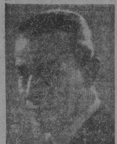
FIGURA DE LA ESCENA