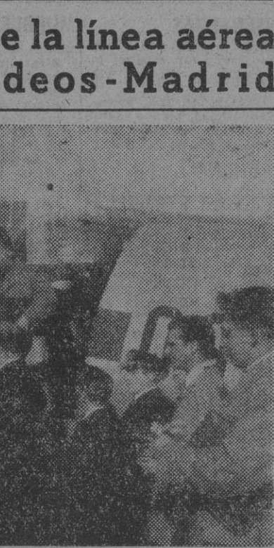
Llegada del avión «DC-3» de la Compañía «Sabena» al aeropuerto de Barajas, procedente de Bélgica, con que queda inaugurada la línea Bruselas-Burdeos-Madrid.