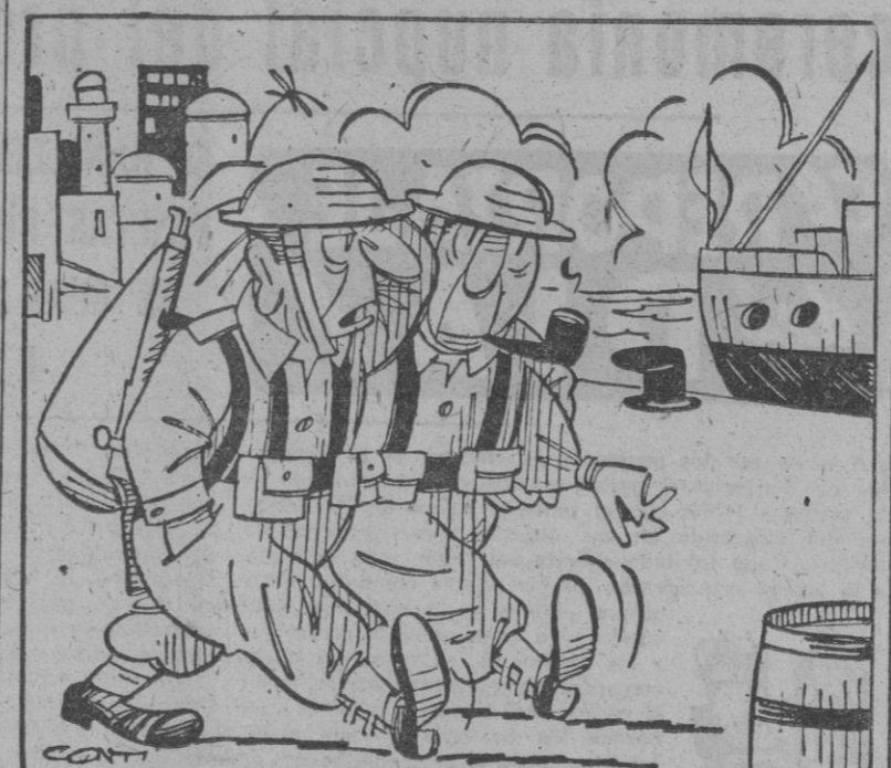
—Como retirada es la más tranquila y bien organizada que hemos hecho.