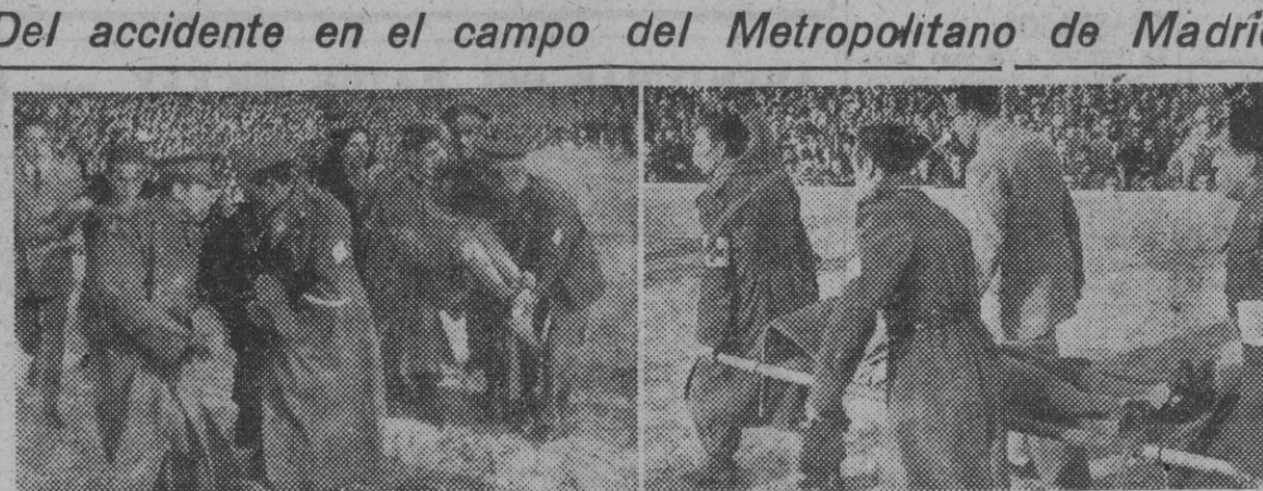
Al producirse, en el partido Madrid-Sevilla, el primer gol del equipo visitante, se produjo una avalancha de espectadores hacia adelante, cayendo unos encima de los otros, resultando más de cuarenta heridos, por fortuna leves. He aquí la Cruz Roja sacando del campo a los lesionados.