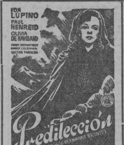
Las famosas hermanas BRONTE revelan el secreto sentimental que dió origen a "Cumbres Borrascosas" y "Jane Eyre"