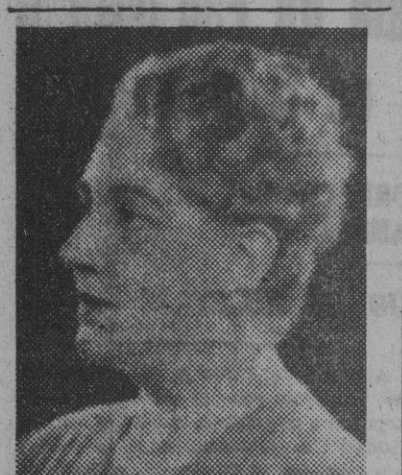
Concha Catalá, la notable y aplaudida actriz, que repone hoy en el Comedia la admirable obra "Madre Alegría"