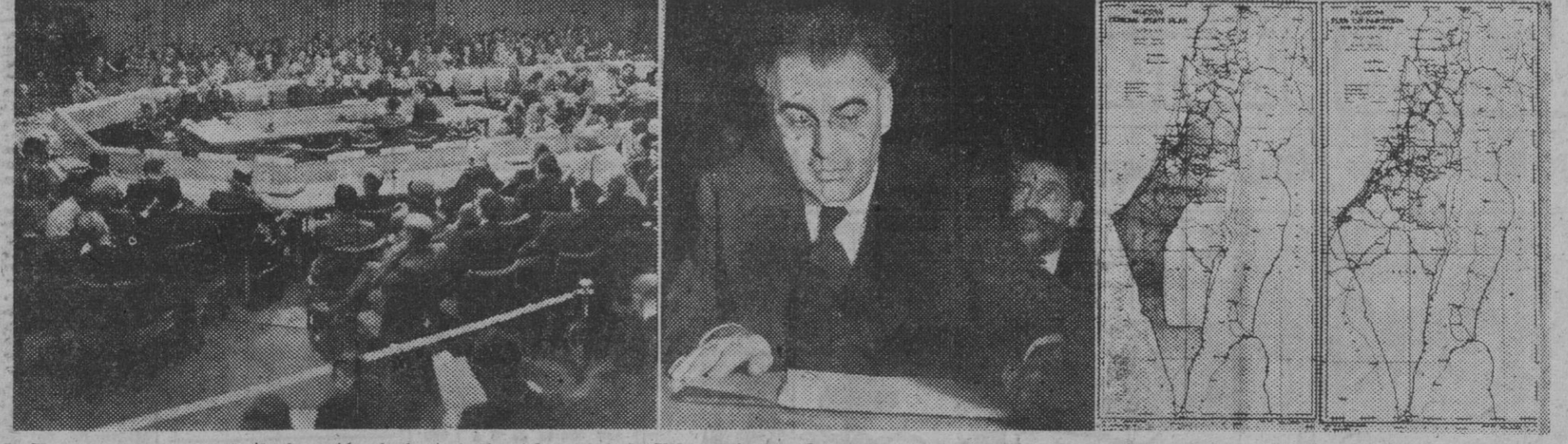
Un interesante momento de la sesión de la Asamblea General de la UNO dedicada a los problemas de Palestina. Del grupo que aparece en el centro, el de la izquierda es el rabino Abba Hillel River, presidente de la Sección Americana de la Agencia Oficial Judía; los asambleístas de la derecha son los componentes del grupo de Estados Árabes. H. Abba Hillel River, que ofreció ante la Asamblea General que, tan pronto como se realizase la partición de Palestina y la retirada de las tropas británicas, un ejército judío se haría cargo de aquélla para garantizar el orden. — III. Estos dos mapas representan las proposiciones hechas por la mayoría y la minoría del Comité de las Naciones Unidas, sobre la partición de Palestina. El de la derecha, propuesto por la mayoría: división del país en tres Estados, con unido económica de los mismos. La parte oscura sería el Estado árabe; la más clara, el judío, y la blanca del todo la ciudad de Jerusalén, que sería regida por un sistema de control internacional. Ahora sólo falta oír la voz de los árabes.