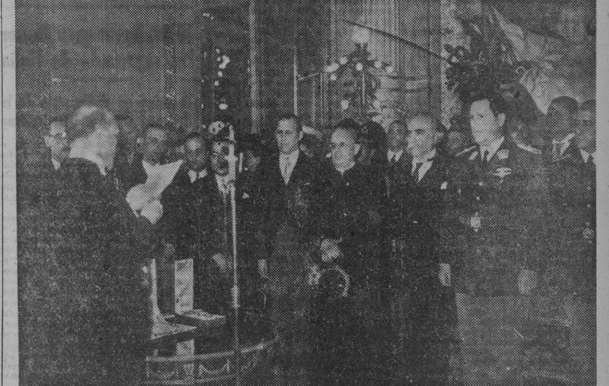
La festividad del 12 de octubre evoca siempre en La Argentina el recuerdo de la Madre Patria, con la que estrecha sus lazos de unión con solemnes actos conmemorativos como el que muestra la fotografía. — El embajador de España ofrece el Collar de Isabel la Católica al general Perón el 12 de octubre de 1946