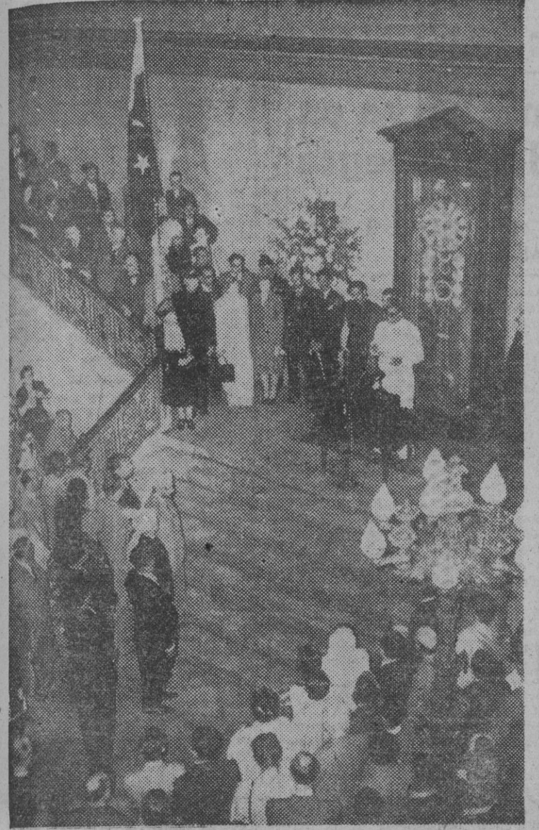
Vista general de la ceremonia celebrada en Lancaster House (Londres) al ser izada oficialmente la bandera del Paquistán, con asistencia de Habib Ibrahim Rahimtoola como alto comisionado del país constituido ya en miembro de la Comunidad Británica de Naciones. Aquí vemos al ilustre representante pronunciando su discurso.