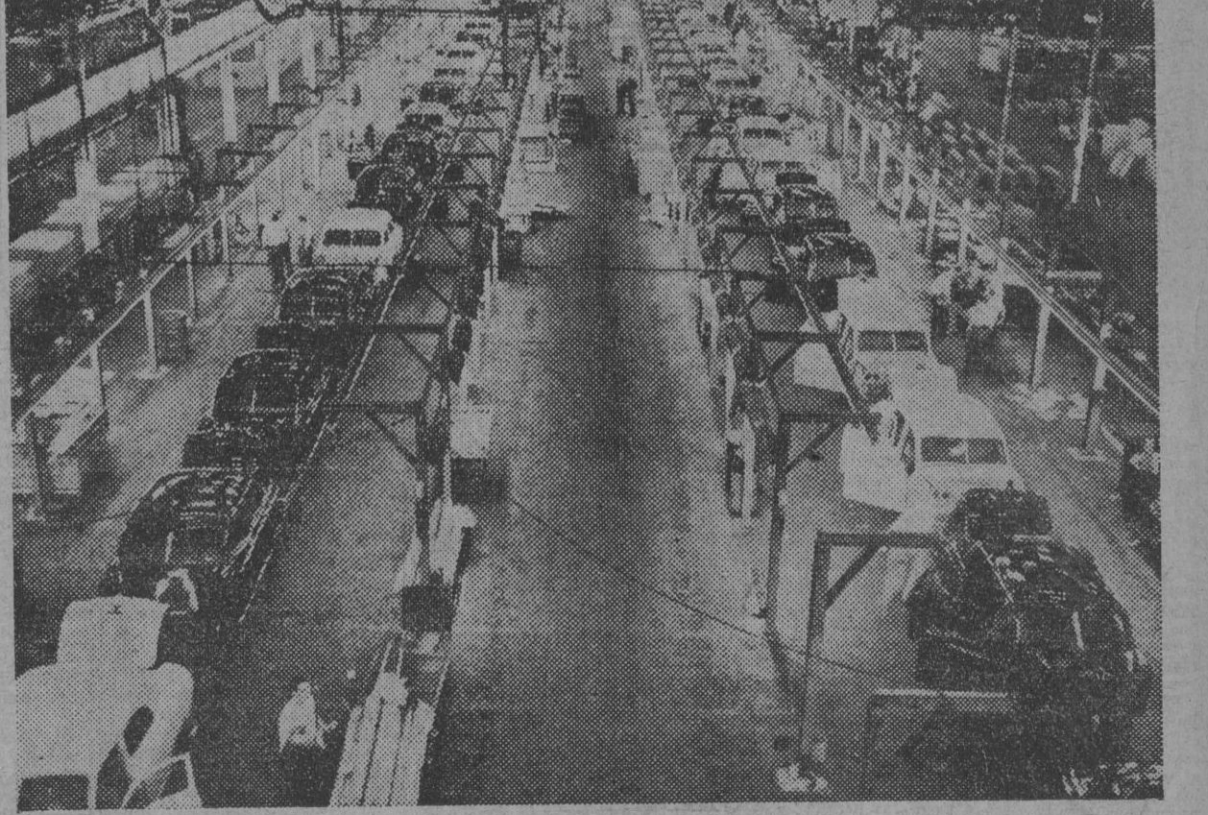
La gran manufactura Kaiser-Frazer Company, que durante la guerra producía aviones de bombardeo, construye hoy cuarenta y cinco coches cada hora. Ho aquí una de las grandes naves.