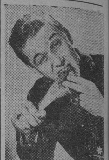
John Carroll, protagonista del film "Mi doctora y yo", que mañana se estrenara en Astoria y Atlanta