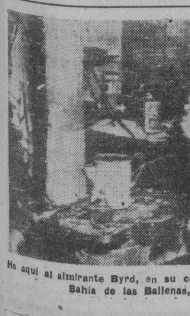
He aquí al almirante Byrd, en su campamento de Little America, en la Bahía de las Ballenas, costa de la Antártida.