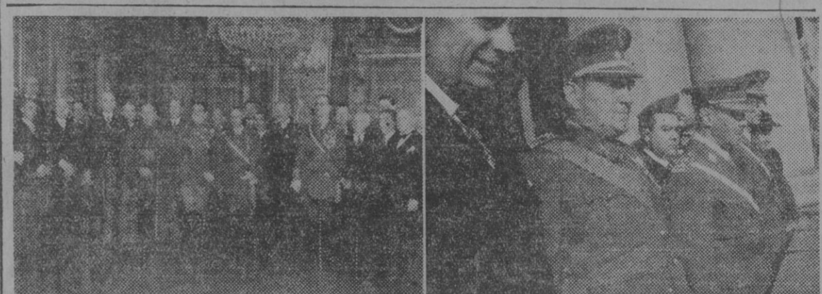
Con motivo de la Pascua Militar se ha celebrado en Capitanía General una brillante recepción. Después del desfile de autoridades y representaciones militares y civiles, el capitán general rodeado de las mismas y del Cuerpo consular, en el salón del Trono. Después presen cia desde el balcón el desfile de fuerzas por el Paseo de Colón.

Los franceses dicen que han terminado sus operaciones de limpieza al NO. de Hanoi