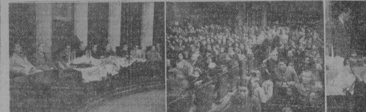
En el Fomento del Trabajo Nacional han sido repartidos juguetes a los hijos de los productores de Arte. Gráficas. — I. Presidencia del acto. — II. Aspetto del salón de actos. — III. El gobernador civil que ha presidido el acto.

La llegada de los Reyes de Oriente fué saludada con aplausos y disparo de cohetes. Las autoridades municipales fueron obsequiadas por los pajes de SS. MM., recibiendo también el cariñoso saludo de los Reyes para los niños y niñas barceloneses.