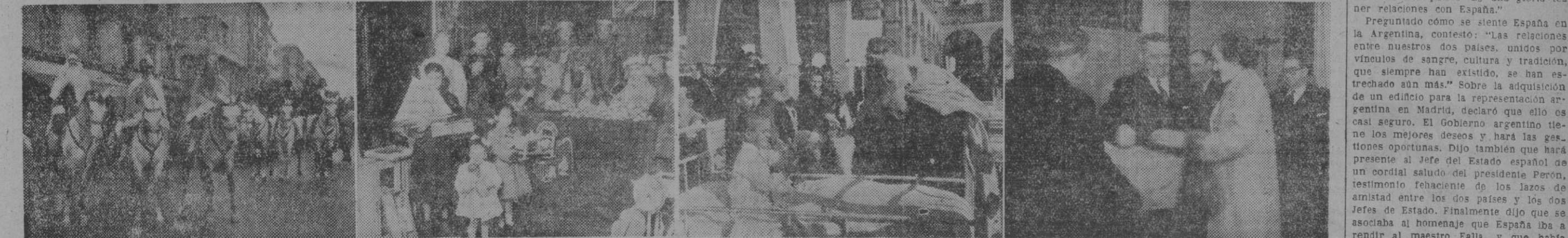
I. Los altos personajes de Oriente, que han presidido la cabalgata organizada por el gobernador civil. — II. Los simpáticos reyes reparten, en la Asociación de la Prensa, juguetes a los hijos de los periodistas. — III. Emocionante ha sido el reparto de juguetes y golosinas en el Hospital de San Juan de Dios. — IV. En la Comisaría de Abastos, el gobernador entrega lotes a los familiares de los funcionarios que tienen hijos