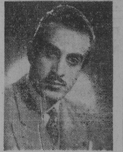
FIGURA DEL TEATRO