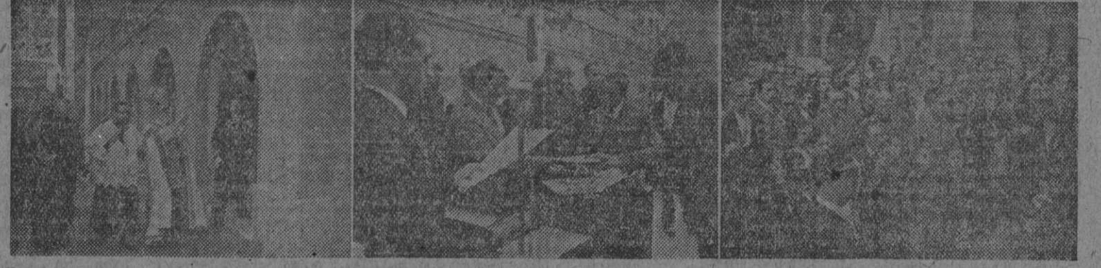
En la barriada de la Barceloneta han sido bendecidas y entregadas hoy a sus beneficiarios, ochenta viviendas protegidas construidas para productores de mercados. La información gráfica nos presenta al obispo de Colón, fray Costa, bendiciendo al bloque; la entrega de los títulos efectuada por el subsecretario de Trabajo, y los familiares de los propietarios de las nuevas casas presenciando la entrega.