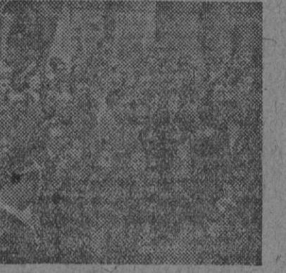
Don Juan Bonelli, gobernador general de Guinea, durante su conferencia en la Casa del Médico.