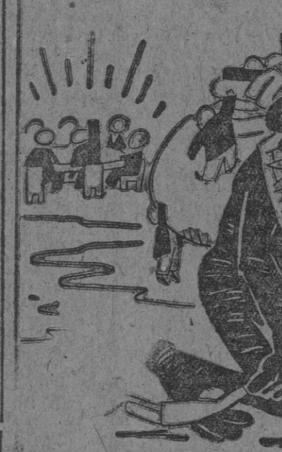
Mientras ellos discuten los terrenos yo me llevo los habitantes.