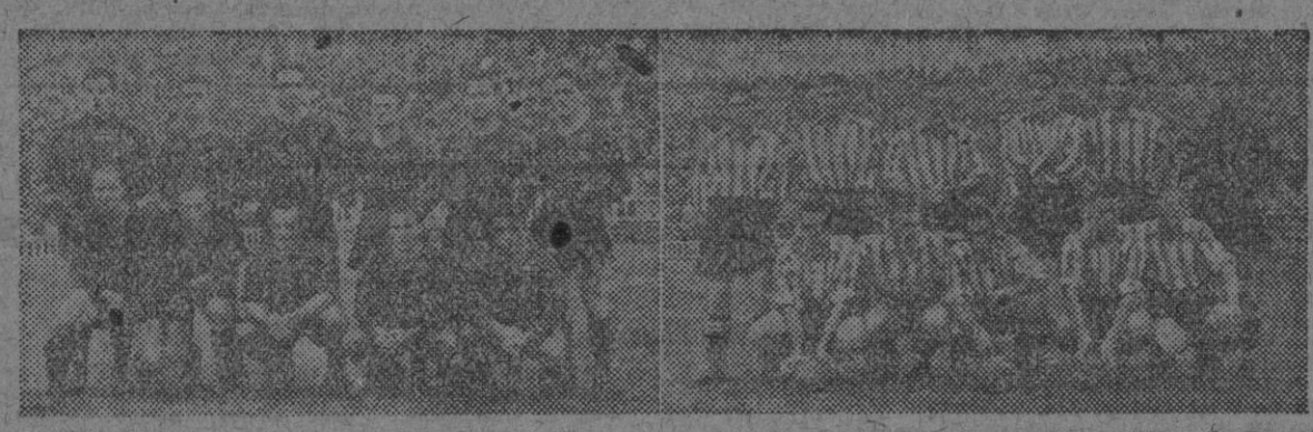
Los equipos del Barcelona y Atlético de Bilbao, que jugaron ayer en Las Cortis.

CON el partido disputado ayer por el Barcelona, los azulgranas demuestran evidentemente hallarse no solamente recuperados sino dispuestos a librar las más grandes batallas. El dos a uno que supo obtener el Barcelona sólo exclusivamente a base de juego y entusiasmo, promete mucho. Los "leones" por esta vez tuvieron que conformarse con su derrota. El Sabadell que debía haber vencido y que la fatalidad no lo quiso así, hubo de conformarse a empatar con un rival a quien hasta dos minutos antes de terminar leucaba la delantera en el marcador. Fue un buen partido el del Madrid, quien continúa de líder a la cabeza de la clasificación. El Español no pudo con los sevillanos en su casa, pese a que en la primera parte hubieran logrado un esperanzador 1 a 0. La victoria del Sevilla, aunque algo discutible — tristes recuerdos nos vienen a la mente —, es válida y ello son dos puntos que le salvan del último puesto. El Valencia ni en Mestalla consigue vencer; su baja forma es evidente, circunstancia que no desaprovechó el Murcia para mejorar su clasificación. El Atlético de Aviación superó todos los pronósticos que cabían hacerse al batir al Oviedo por un respectable cinco a cero. En Melián, los locales vencieron a sus visitantes los coruñeses. Y el Castellón dio la sorpresa al arrebatar un punto nada menos que a los vigueses en Baladois. El Barcelona empieza a desprenderse de sus restantes compañeros catalanes, en tercer puesto y a dos puntos del líder.