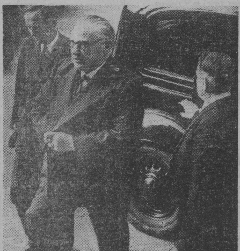
Mr. Bevin llega a París para asistir a la Conferencia de los ministros de Asuntos Exteriores de las cuatro grandes Potencias. Acompaña la escolta que acompaña al ministro, en prevención de cualquier amenaza terrorista de las que se habló en los últimos días contra dicho ministro.