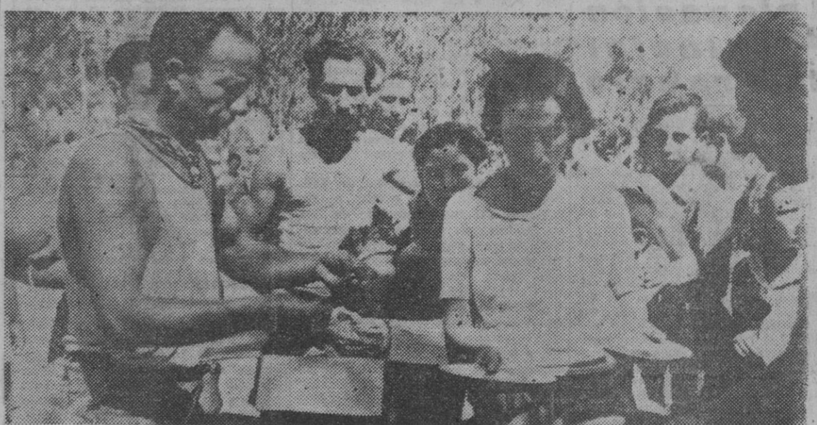
Niños en cola para coger la comida, en un campo de concentración para inmigrantes judíos ilegales, deportados de Palestina a Chipre. Con la ración, se les reparte también caramelos que les han sido enviados por los israelitas residentes en Chipre

La organización anti-Tito trabaja para derribar el actual régimen yugoslavo