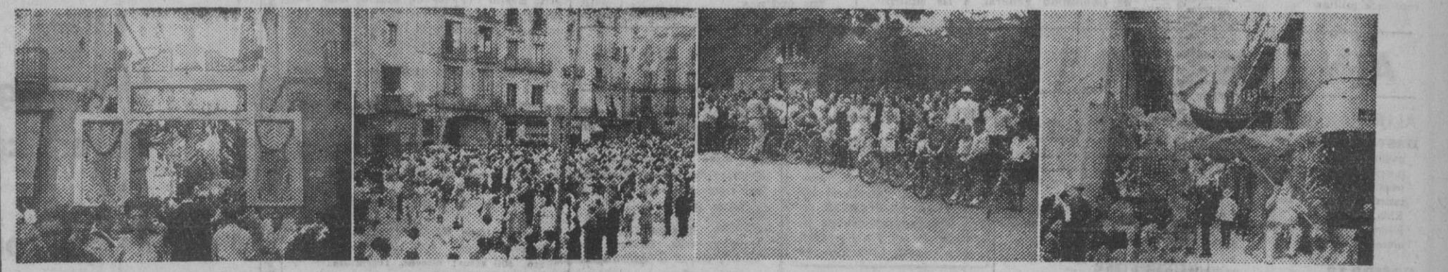
La festividad de la Asunción, lleva de la mano la celebración de la mayoría de las fiestas mayores de Barcelona y su provincia. Nuestra información gráfica nos da una bella impresión de estos actos populares, con la calle de Torrijos de Gracia en primer término; luego las sardanas de la plaza Nueva con motivo de las fiestas de San Roque; sigue la alineación de los futuros campeones ciclistas preparándose para la carrera, campeonato infantil celebrada en Gracia, y, finalmente, la alegoría marítima con que ha sido adornada la pacífica calle de Mateu.