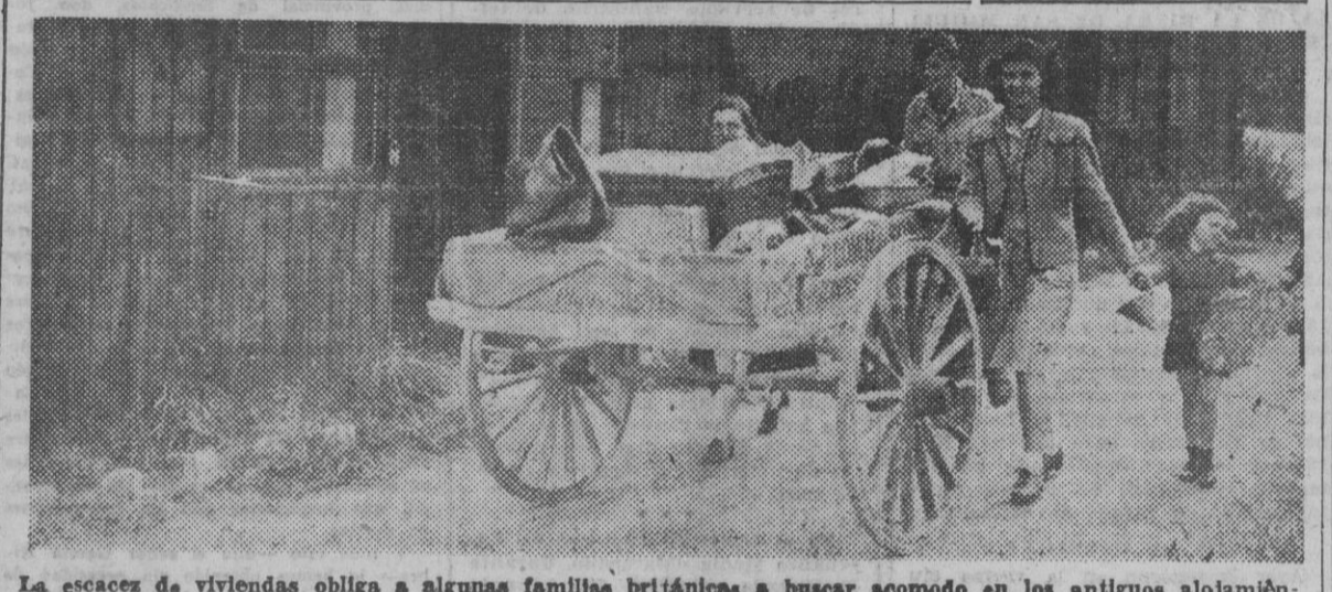
La escasez de viviendas obliga a algunas familias británicas a buscar acomodo en los antiguos alojamientos provisionales de tropas.