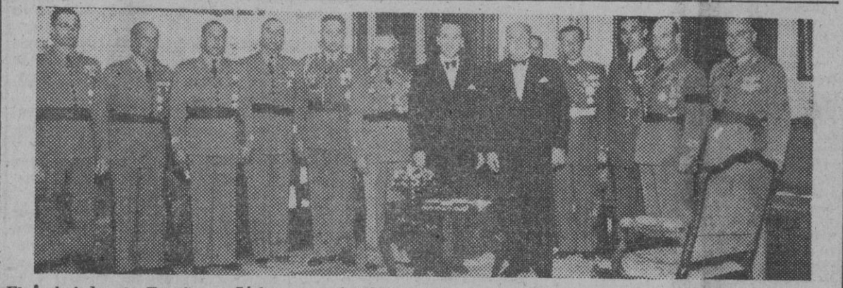
El embajador de España en Lisboa, con el subsecretario portugués de la Guerra, y los jefes y oficiales de la nación vecina, a quienes el embajador impuso las insignias de la Orden del Mérito Militar.