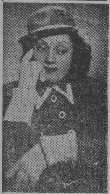
FIGURA DEL TEATRO

Nini Montiam, la bella y elegante actriz que al frente de un notable conjunto se presentará el próximo martes, en el teatro de la Comedia, estrenando en "Galas de Prensa", la comedia de Muñoz Lorente y Tejedor: "La señora de González".