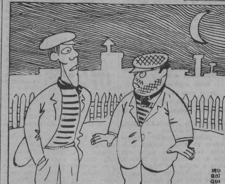
—Ya sabes, hay que boicotear todo lo que venga de España. En 10 sucesivos sólo nosotros podremos llenarnos los bolsillos de naranjas.