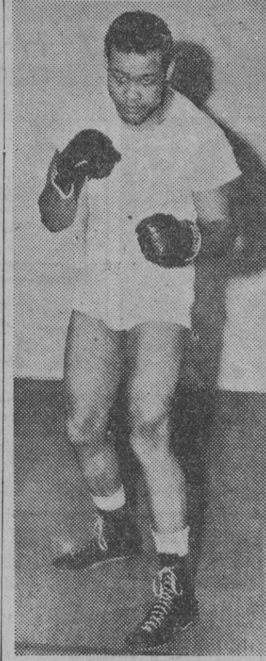
Esta noche tendrá efecto en el Cine de Verano de la Plaza de Toros las Arenas, el espectáculo confeccionado por RKO Radio Films y la empresa Balala. Es un programa excepcional, a base de dibujos Walt Disney, el combate en que Joe Louis fué vencido por Max Schmelling — única derrota sufrida por el actual campeón mundial de boxeo— y la épica lucha por este Campeonato de pesos pesados, disputada el día 19 del actual en Nueva York, entre los colosos Joe Louis y Billy Conn.

El Club de Natación Barcelona, al objeto de preparar convenientemente los equipos que han de representar en los campeonatos de Cataluña, ha organizado para celebrar mañana, domingo, y los días 14 y 21 de Julio, unas pruebas en las que tomarán parte todos los preseleccionados y que se desarrollarán bajo el siguiente programa: Infantil «handicap» 50 - 100 y 200 metros crol; 100 metros esp. y 100 brazas. Infantil femenino «handicap» 50 y 100 metros crol; 100 metros braza y 100 espalda. Cadetes «h» 100 y 200 metros crol; 100 espalda y 200 brazas. Juveniles «h» 100 y 200 metros crol; 100 espalda y 200 brazas. Femenina «h» 100 metros crol; 100 metros espalda y 200 metros braza. Seniors «h» 100 y 200 metros crol; 100 metros espalda y 200 brazas. No cabe duda de que resultará una muy reñida competición teniendo en cuenta los deseos, de todos, de verse clasificados para tomar parte en los campeonatos de Cataluña a celebrar próximamente.