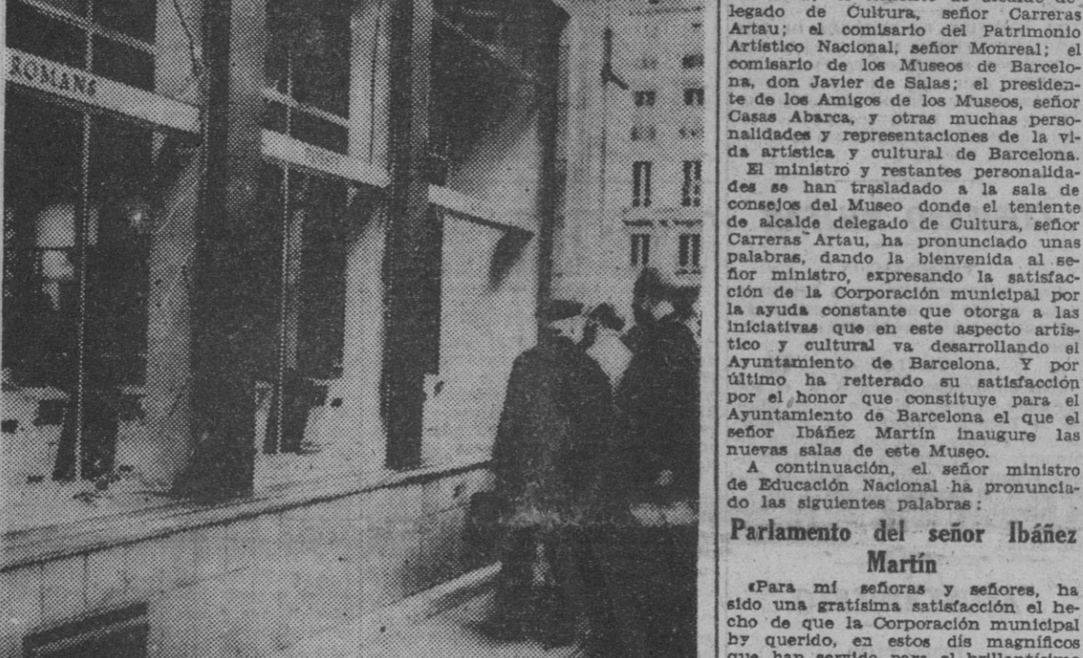
En la foto se aprecia el estado en que quedaron los escaparates de un centro de propaganda comunista, que fueron rotos, y quemado todo su contenido, por los manifestantes en la noche del 18 de junio.