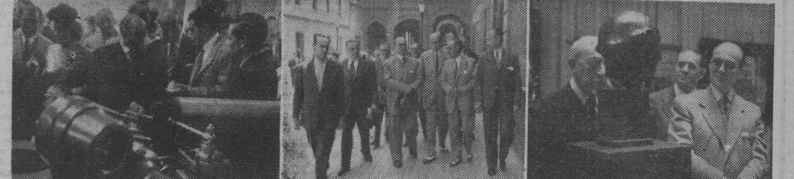
Ayer tarde, el señor Ibáñez Martín, acompañado de su distinguida esposa, verificó una detenida visita a la Feria Internacional de Muestras, y en la mañana de hoy ha visitado la Escuela Industrial y ha inaugurado varias nuevas salas en el Museo de Arte Moderno del Parque de la Ciudadela.