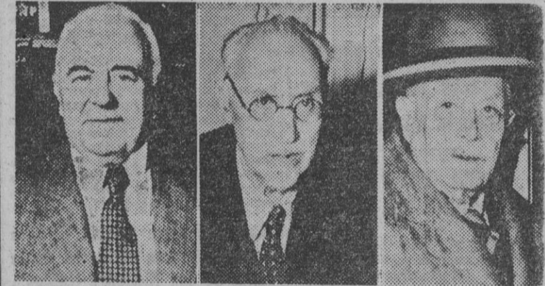
De izquierda a derecha, Francesco Nitte, Ivanoe Bonomi y Vittorio E. Orlando, cuyos nombres se mencionan para candidatos a la Presidencia de la República Italiana...