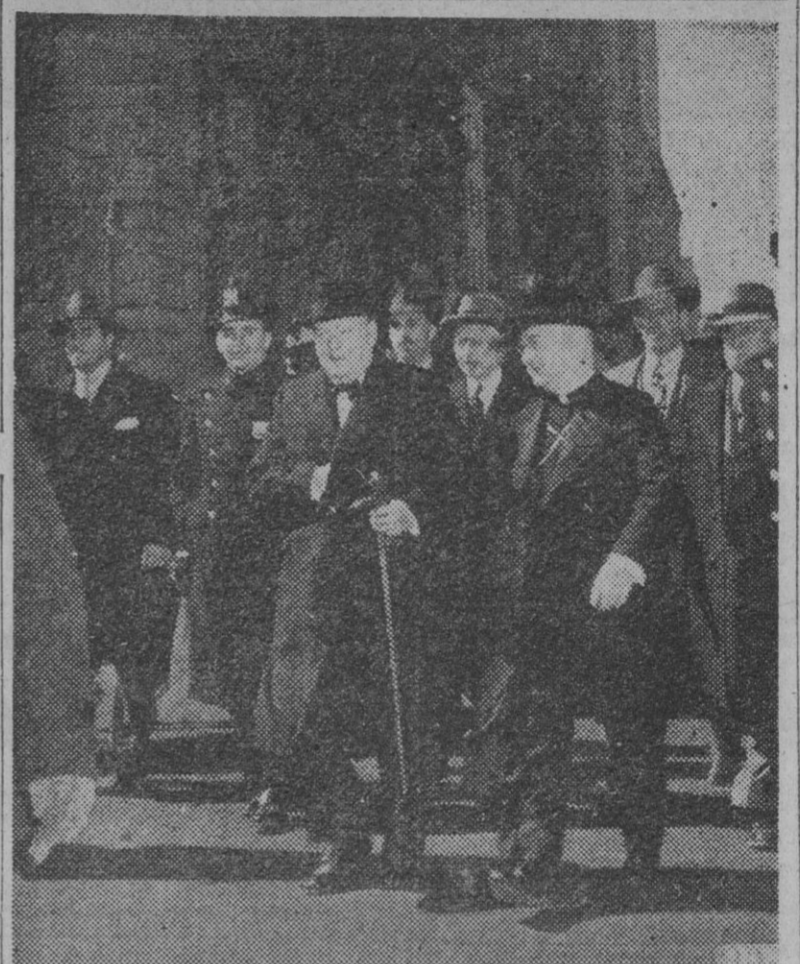
Cuando el cardenal Spellman devolvió a Mr. Churchill la visita que éste le había hecho, ambas personalidades decidieron dar un paseo a pie por la ciudad y en el grabado puede verseles en el cruce de la calle 49 y Park Avenue, rodeados por la escolta del ex primer ministro británico.