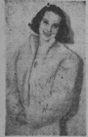
Tita García, la aplaudida artista que mañana celebra en el teatro Romea, su función de homenaje