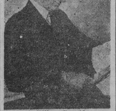
Sir William Beveridge