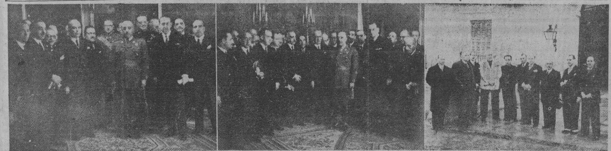
El Caudillo con el presidente y miembros del Consejo Nacional del Colegio de Médicos y con el director general de Enseñanza Profesional y Técnica y directores de Escuelas Especiales y Técnicas, que le visitaron para testimoniarle su adhesión, y el alcalde de Gijón con el Consejo de Honor y Comité Ejecutivo de la Exposición de productos del Noroeste de España, al salir del Palacio de El Pardo.