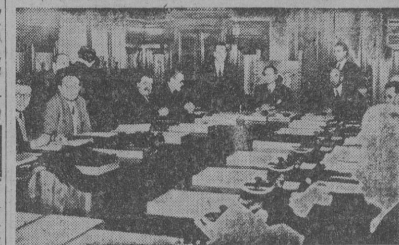
Alcide de Gasperi, preside una reunión del Gobierno italiano

orientación cristiana del Estado, la protección al campesino y al obrero y una avanzada legislación social. Al mismo tiempo no se negaba a colaborar con los socialistas. Su política moderada recibió pronto el asenso popular y, después de treinta años en que las fuerzas católicas no tuvieron una representación homogénea dentro de la Cámara y en los que la legislación siguió francamente izquierdista, con el fin de erigirse como el partido del Centro, alemán—en el ámbito de la política italiana. En el año 1920 el partido católico llevó a la Cámara 107 diputados y su posición intermedia entre las clásicas derechas e izquierdas dio a sus representantes un trascendental papel en la política italiana de la post-guerra. El advenimiento del fascismo extinguió la vida pujante del partido de Dom Sturzo. Muchos de sus miembros fueron perseguidos por la nueva política iniciada con la marcha sobre Roma y uno de sus principales miembros—Alcide de Gasperi—tuvo que buscar refugio entre los muros vaticanos, donde el Papa Pío XI le nombró bibliotecario de los Palacios Pontificios.