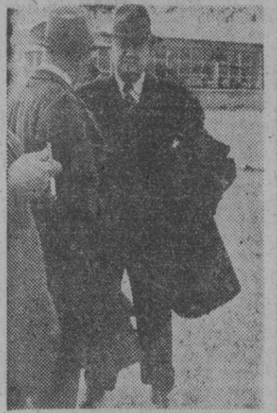
El general norteamericano Wilson, presidente de la "Trans World Airline", que ha llegado a Madrid con objeto de ultimar los detalles para la implantación del servicio aéreo Nueva York-Madrid.

Entrega de despachos a la cuarta promoción de ingenieros aeronáuticos