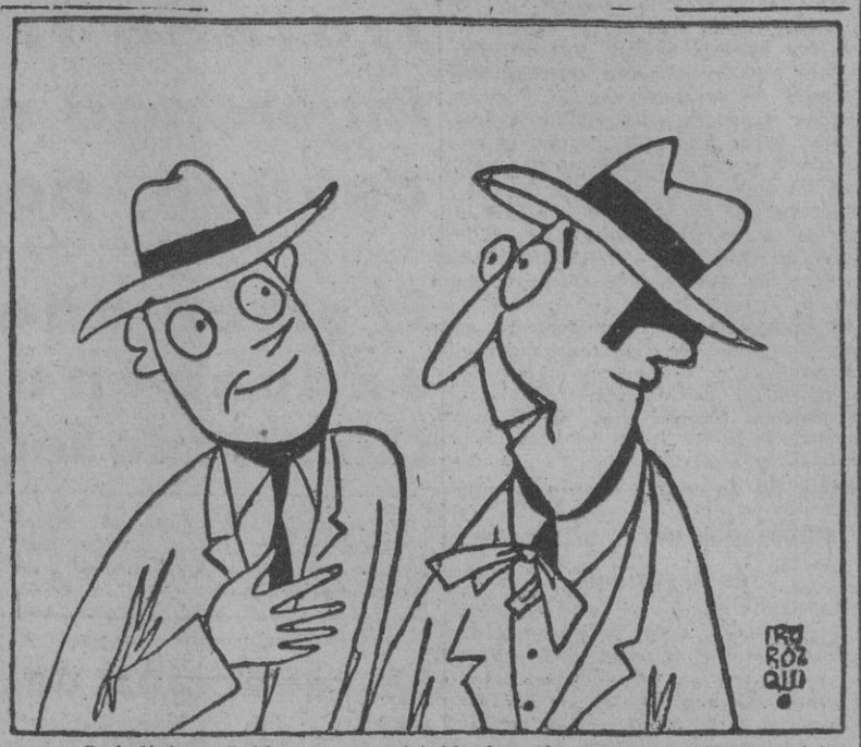
¿Qué dirá el Gobierno comunistoide francés al ver que Norteamérica vuelve a rechazar la idea de que España amenaza nada menos que la Paz mundial? — Pues fígurese. Que el Gobierno yanqui es una "banda de fascistas"