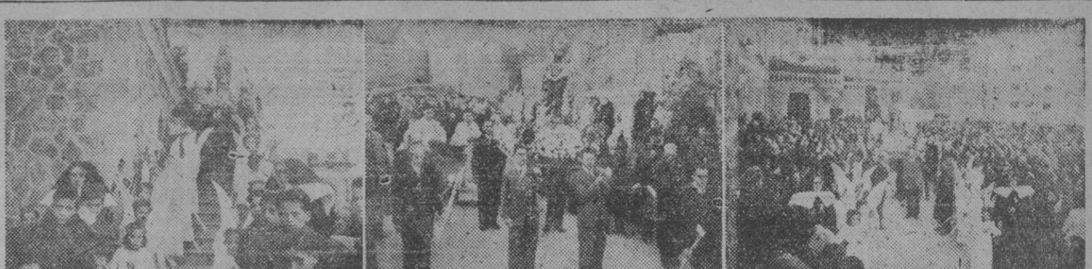
Tres aspectos de la procesión celebrada en la terraza del Santuario de San José de la Montaña, con motivo de celebrarse en dicho templo la fiesta patronímica.