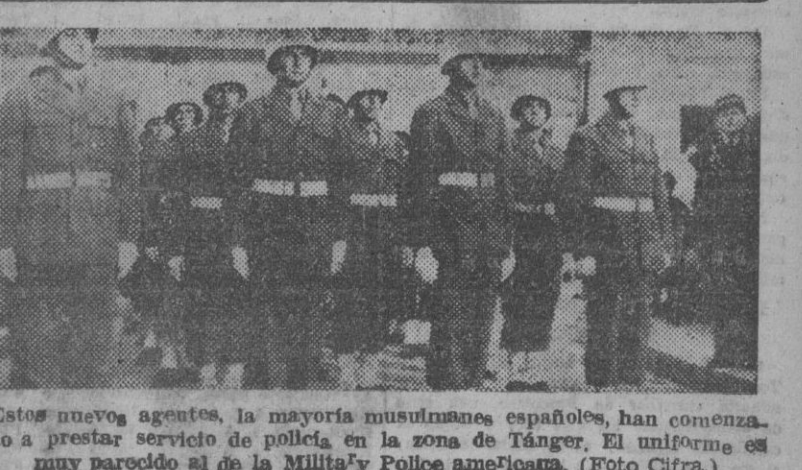
Estos nuevos agentes, la mayoría musulmanes, españoles, han comenzado a prestar servicio de policía en la zona de Tánger. El uniforme es muy parecido al de la Milicia y Police americana.