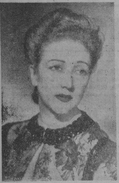
FIGURA DEL TEATRO