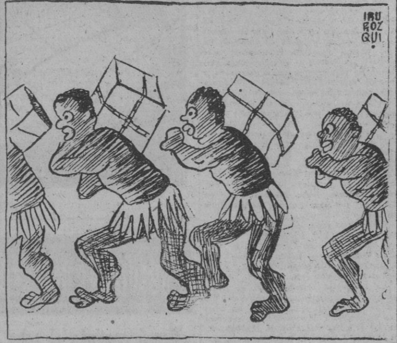
—Nuestro objetivo ha captado la visión que de nuestra Patria tienen algunos sectores del extranjero.