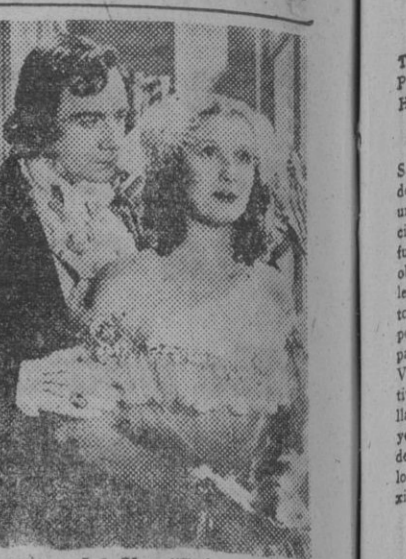
Una escena del film «Primer ministro (Disraeli)»...