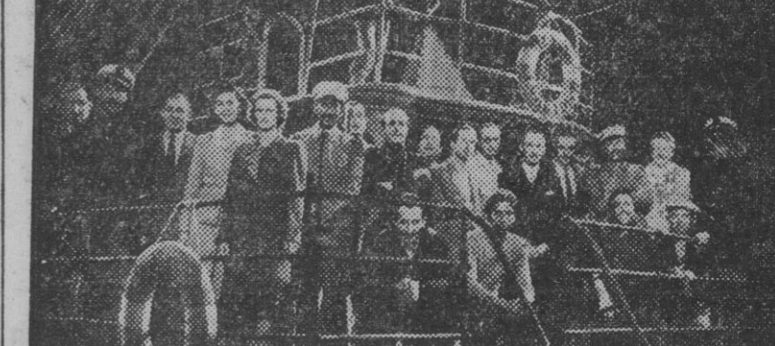
La foto recoge una escena de la película 'Los últimos de Filipinas'...