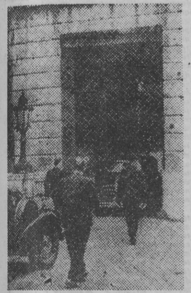
La foto muestra a tres de los "protectores" de Molotov, que acaba de abandonar el primer coche negro para la reunión de los "cinco grandes"