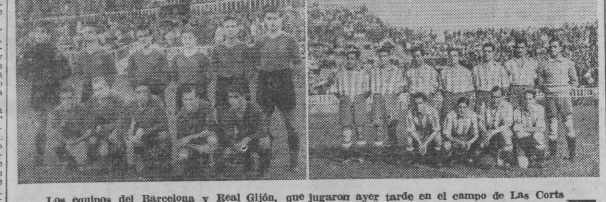
Los equipos del Barcelona y Real Gijón, que jugaron ayer tarde en el campo de Las Cortes (Fotos Pérez de Rozas)

Los equipos del Barcelona y Real Gijón, que jugaron ayer tarde en el campo de Las Cortes (Fotos Pérez de Rozas) No debe destacarse la actuación de ninguno de los dos equipos como conjunto; en cuanto a individualidades brillaron en el equipo asturiano por encima de los restantes compañeros, el defensa Jujo y el medio izquierdo Sirio, y Antón en la delantera. En el equipo catalán, Veloz, el medio derecho, y Calvo, que fué más completo y más ejecutor que el centro Morales. El arbitraje de González, sin dificultad alguna, puesto que ambos equipos se emplearon con nobleza. Un lleno en Buenavista y un resultado muy pobre. A las órdenes del colegiado Plácido González se alinearon en el campo de Buenavista, para jugar el partido inaugural de la temporada, los siguientes equipos: ESPANOL: Trias, Ternel, Llimós, Veloz, Jorge, Eizaguirre, Hernández (R.), Hernández (V.), Morales, Calvo y Agustí. OVIEDO: Aguilu, Jujo, Pera, Sansón, Diezro, Sirio, Antón, Alcalde, Chas, Herterria y Emilián. — Cifra.