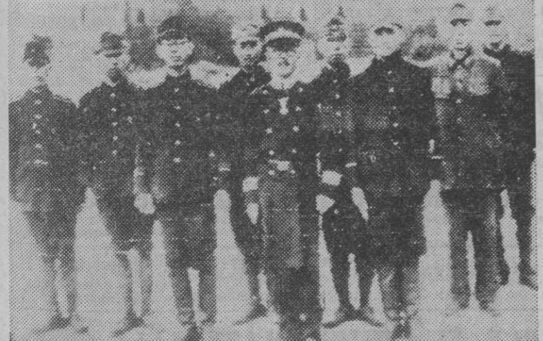
El día de la apertura de la Dieta japonesa, Hiro Hito asistió a la sesión acompañado de su guardia personal. La foto muestra el personal de escolta del emperador, desarmado, esperando la salida de éste del Parlamento.