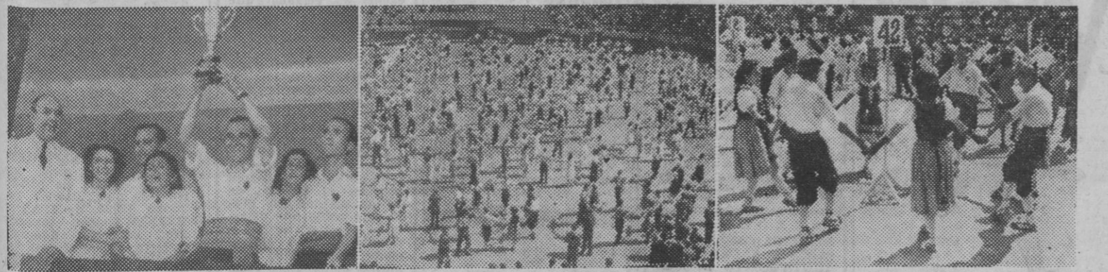
I. El presidente de la Asociación de la Prensa entrega la copa del gobernador civil al grupo "Rosaleda". — II y III. Dos momentos del grandioso festival.