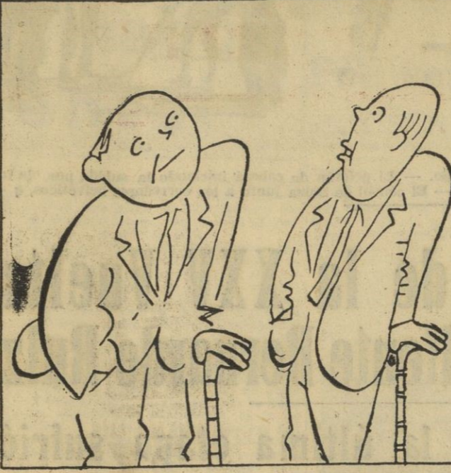
— El asunto está claro. Si llueve habrá cosecha, luz, agua, abundantisima... y, naturalmente, no habrá crisis en la producción lechera.