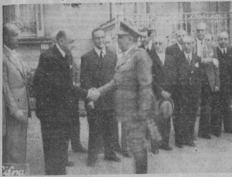
Las autoridades donostiarrias cumplimentan a S. E. el Jefe del Estado a su llegada al Palacio de Ayte.