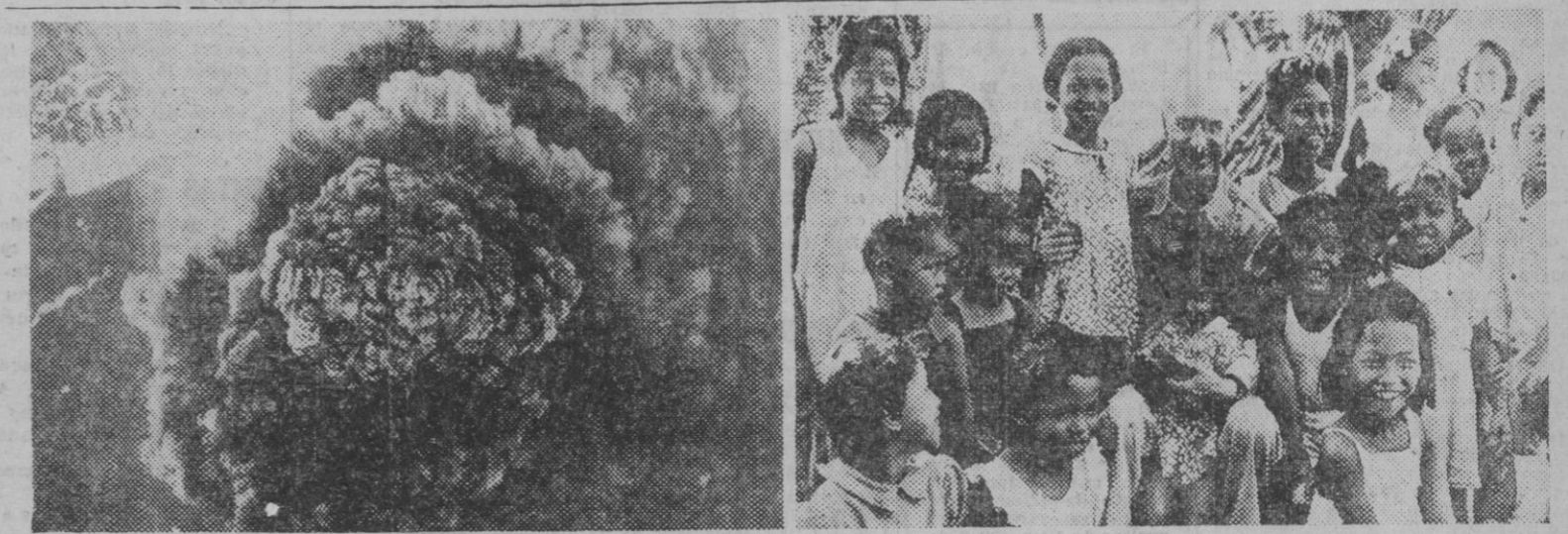
I. Espesas nubes de humo se elevan de la refinera de petróleo de Ota-Ke (Japón), después de ser atacada por aviones norteamericanos. II. Ernie Pyle, famoso corresponsal de guerra norteamericano, rodeado de chiquillos en la Jima, durante su visita a esta base aérea, en la que resultó muerto después por el fuego de una ametralladora japonesa