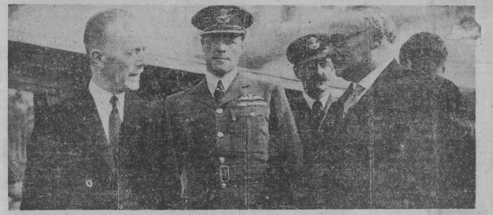
Mr. Ernest Bevin, ministro de Asuntos Exteriores de la Gran Bretaña, hablando con Sir Alexander Cadogan, subsecretario permanente del Foreign Office, en el aeropuerto de Potsdam, terminada la conferencia de los "Tres Grandes". — (Foto Shows)