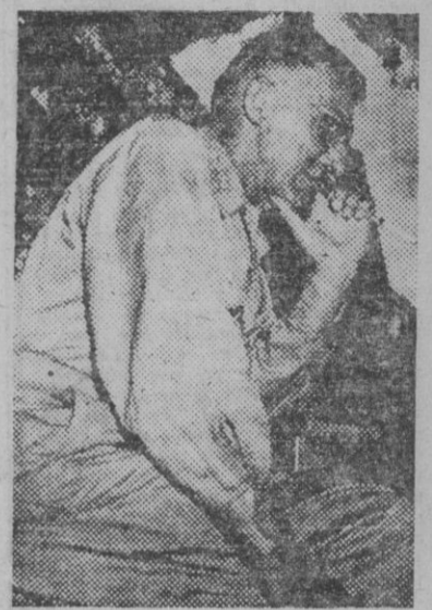
El general Stilwell, jefe del X ejército norteamericano del Pacífico.