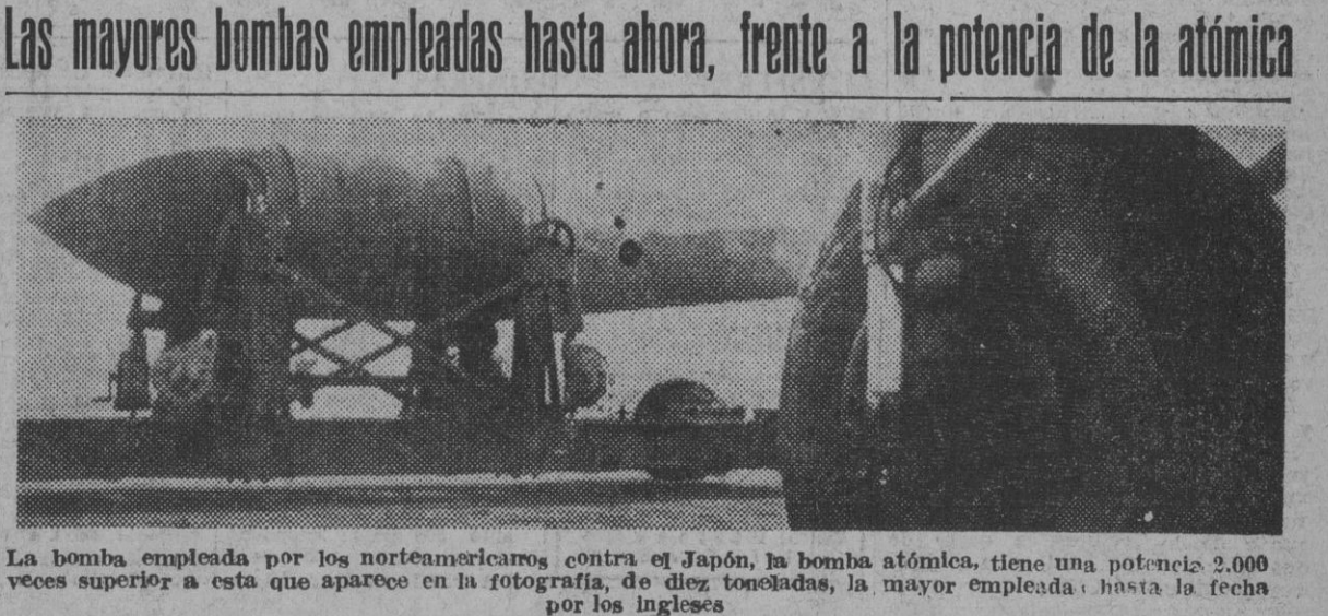
La bomba empleada por los norteamericanos contra el Japón, la bomba atómica, tiene una potencia 2.000 veces superior a esta que aparece en la fotografía, de diez toneladas, la mayor empleada hasta la fecha por los ingleses