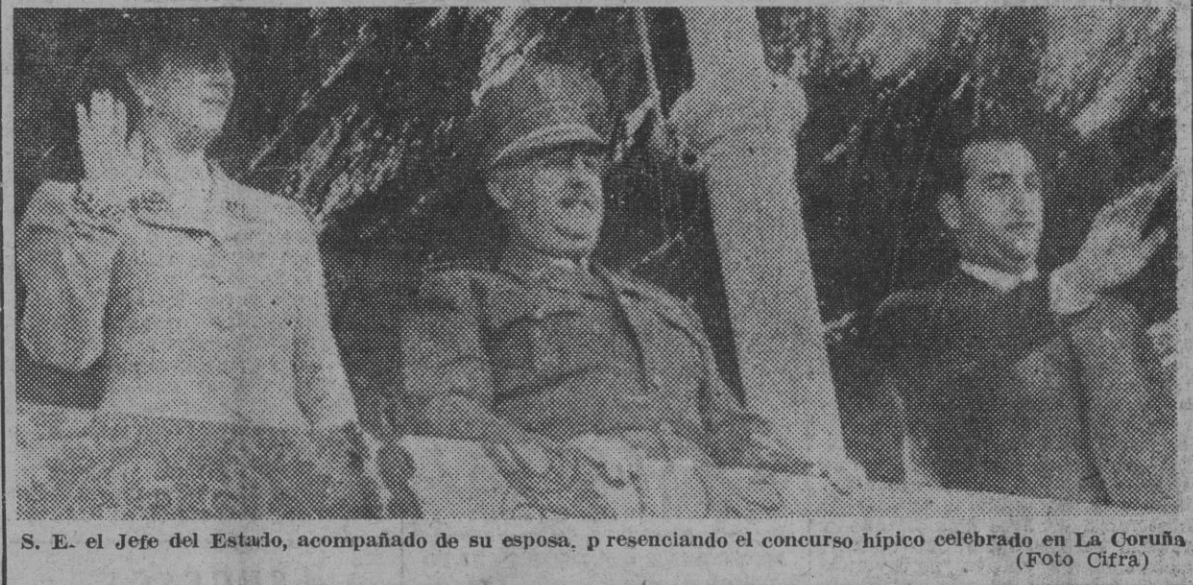
S. E. el Jefe del Estado, acompañado de su esposa, presenciando el concurso hípico celebrado en La Coruña

El Caudillo, en el concurso hípico de La Coruña