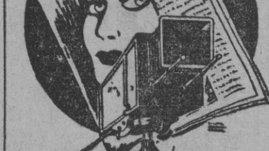
LA PRIMERA REVISTA ESPAÑOLA DE CINE ES PRIMER PLANO

LAS PALMAS, 9. — Muy de mañana llegaron al puerto tres patrulleros ingleses, procedentes de la costa de África. Poco más tarde llegaron otros dos patrulleros, de la misma nacionalidad y de igual procedencia. Todos ellos atracaron al muelle para proveerse de agua y carbón. — Cifra.