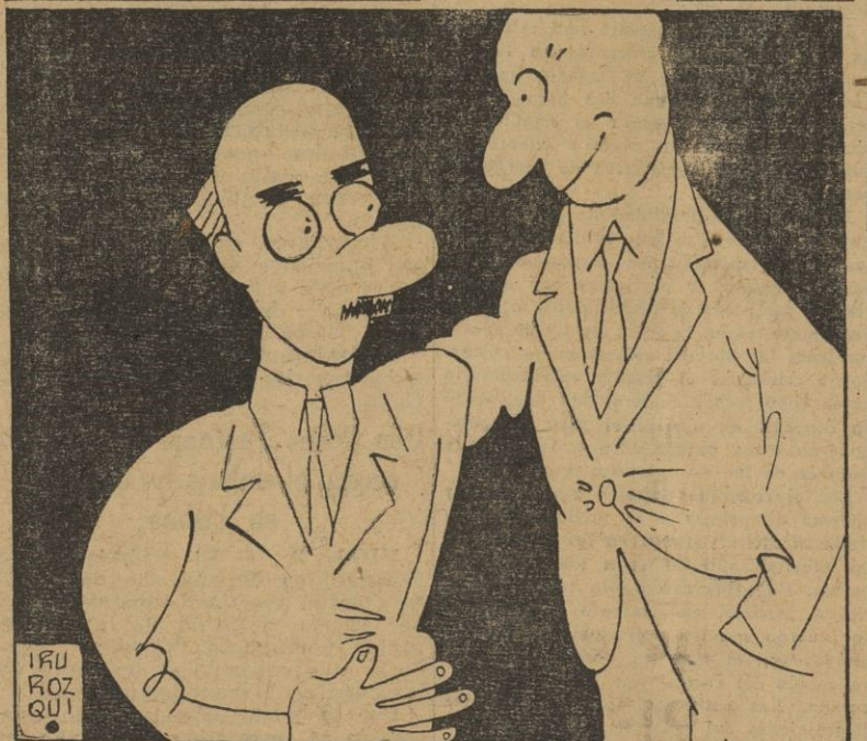
— Con cuatro gramos de uranio puede destruirse todo un continente. ¿Y no podría usted proporcionarme medio gramo? He tenido unas palabritas con mi suegra, y...