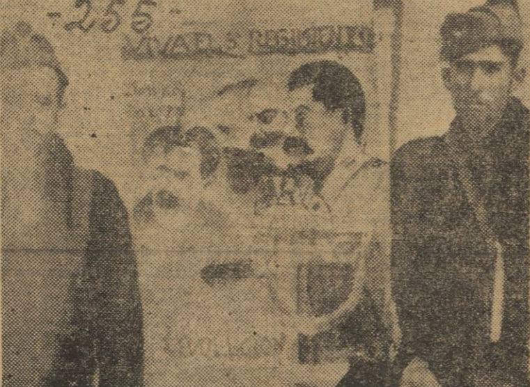
Ejército del Frente Popular. (Fotografía aparecida en la zona roja en el número 1368 del diario "Ahora", página quinta.)