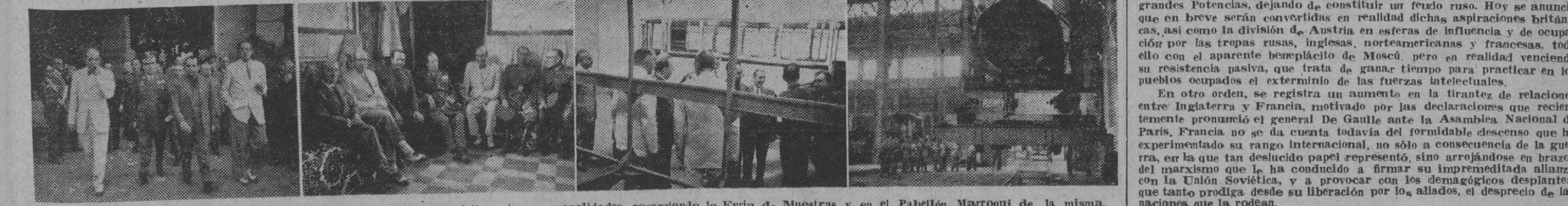
I y II. El director general de Transportes Militares, con el gobernador civil y otras personalidades, recorriendo la Feria de Muestras y en el Pabellón Marroquí de la misma. III y IV. Las mismas personalidades durante su visita a los talleres de la R. E. N. F. E. en San Andrés.