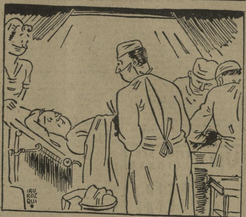
El médico bromista: — ¿Cómo quiere que le dejemos los riñones? — Al jerez.

Homenaje de Valladolid al teniente general Solchaga