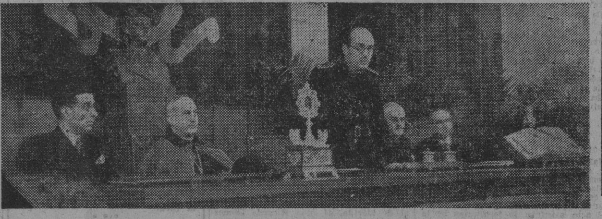
Bajo la presidencia del Excmo. señor ministro de Educación Nacional, se ha reunido en Madrid la sesión del pleno del Consejo Nacional de Investigaciones Científicas.