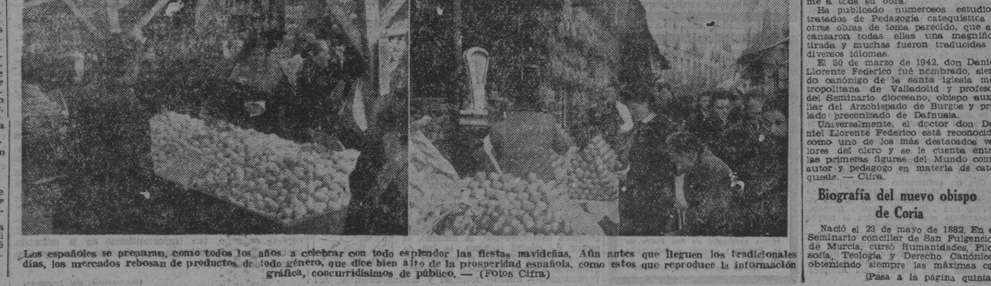
Los españoles se preparan, como todos los años, a celebrar con todo esplendor las fiestas navideñas. Aún antes que lleguen los tradicionales días, los mercados rebosan de productos de todo género, que dice bien alto de la prosperidad española, como estos que reproduce la información gráfica, concurrenciosos de público.