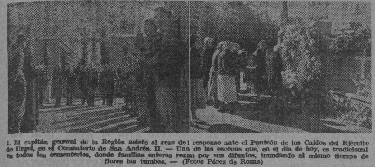
1. El capitán general de la Región asiste al rezo del responso ante el Pantéon de los Caídos del Ejército del Urzel, en el Cementerio de San Andrés. II. — Una de las escenas que, en el día de hoy, es tradicional en todos los cementerios, donde familias enteras rezan por sus difuntos, inundando al mismo tiempo de flores las tumbas.