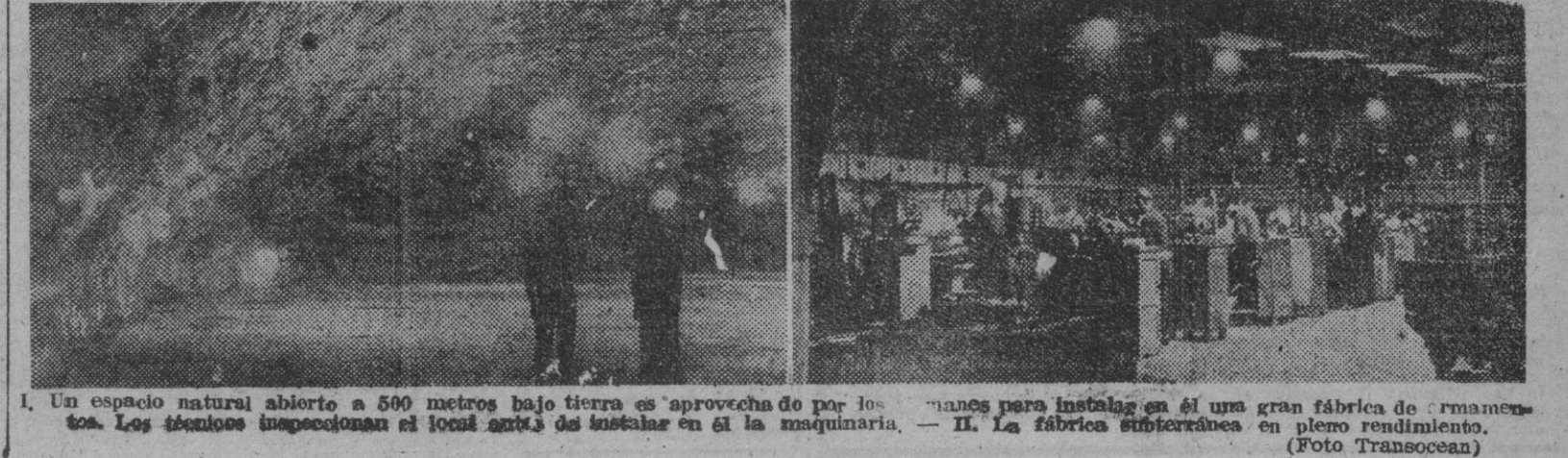
I. Un espacio natural abierto a 500 metros bajo tierra es aprovechado por los japoneses para instalar en él una gran fábrica de armamentos. Los técnicos inspeccionan el local antes de instalar en él la maquinaria. — II. La fábrica subterránea en pleno funcionamiento.