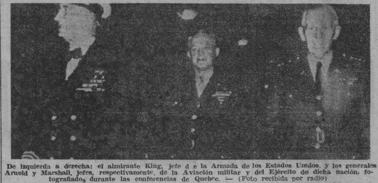
De izquierda a derecha: el almirante King, jefe de la Armada de los Estados Unidos, y los generales Arnold y Marshall, jefes, respectivamente, de la Aviación militar y del Ejército de dicha nación, fotografiados durante las conferencias de Quebec. — (Foto recibida por radio)

En el sur entran en Ronchamp, al O. de Belfort