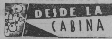
DE LA CABINA

Buen libro para el aficionado es la «Historia de los matadores de toros 1738-1943», dado a la estampa en la imprenta Castell-Bonet, S. A., Barcelona, por el ilustre escritor y crítico taurino «Don Ventura».