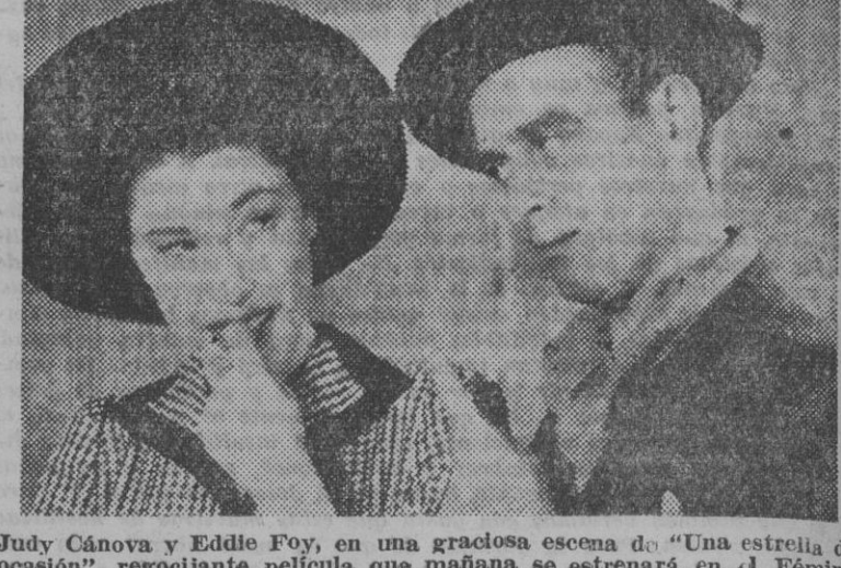
Judy Canova y Eddie Foy, en una graciosa escena de «Una estrella de ocasión».