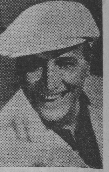
Florián Rey, el veterano director español, que va a comenzar el rodaje de una película de ambiente histórico, «Don Miguel de Mañara»