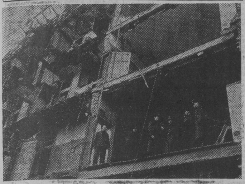
El ministro del Reich, doctor Goebbels, en la visita de inspección hecha a los barrios berlineses afectados por las últimas incursiones aéreas de la aviación aliada.

«El amor a España está profundamente arraigado en el pueblo argentino»