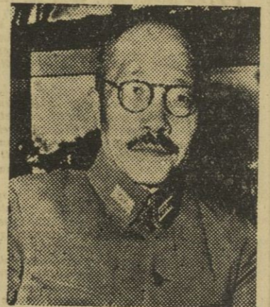
Marina, almirante Shimada, se ha hecho cargo de la jefatura del Almirantazgo, en substitución del gran almirante Nagano. — Efe.