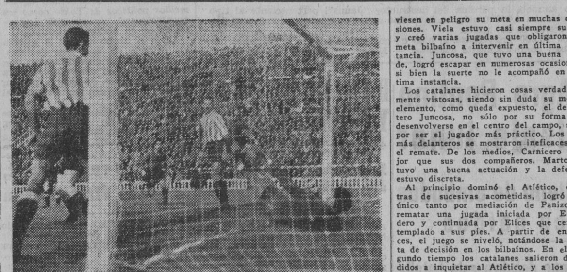
He aquí la prueba gráfica e irrefutable del gol conseguido por el Barcelona, a los veinte minutos de la primera parte, y que el señor Mazagatos no concedió. Véase a Ederra que, caído dentro de la raya, saca el balón que le tenía en su pecho, en la posición que marca la instantánea, a dos palmos pasados de la raya. El balón había penetrado totalmente dentro de la portería y, sin embargo, el señor Mazagatos, que se encontraba colocado en el poste, pues la jugada fue de un saque de esquina, no lo dio por válido.

Por el encuentro de ayer en Las Cortes, se vio jugar a un buen fútbol y se vio a un equipo, al Atlético Aviación, que ha realizado la mejor exhibición de juego en los campos catalanes en esta Liga. Es última que tanta belleza y tan magnífica clase, no la demostraron desde el primer momento los atléticos madrileños, porque hubieran sido los campeones indiscutibles. Sucumbió el Barcelona por varias razones que anotamos en la crónica correspondiente. Tres empates se dieron en San Mamés, Cruz Alta y Riazor, respectivamente, favoreciendo al Español y al Granada, con perjuicio para el Sabadell y Coruña. Sobre todo de los vallesanos, que teniendo ganado el partido, una apreciación rigorista cuando faltaban dos minutos para terminar se vio repudiada su ganancia por un penalty involuntario.