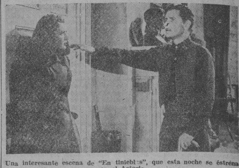
Una interesante escena de "En tinieblas", que esta noche se estrena en el Astoria