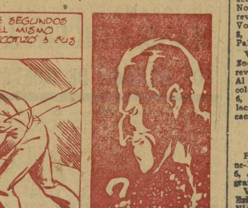
PEPE NO COMPRENDE LA INTENCION DE SU AMIGO PUJOL.