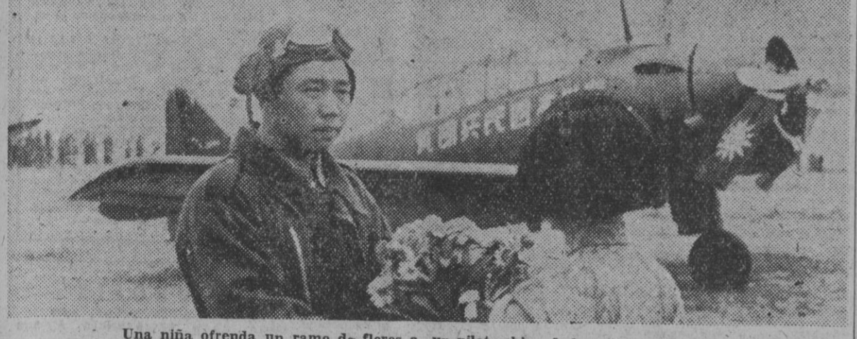
Una niña ofrenda un ramo de flores a un piloto chino de la milicia voluntaria