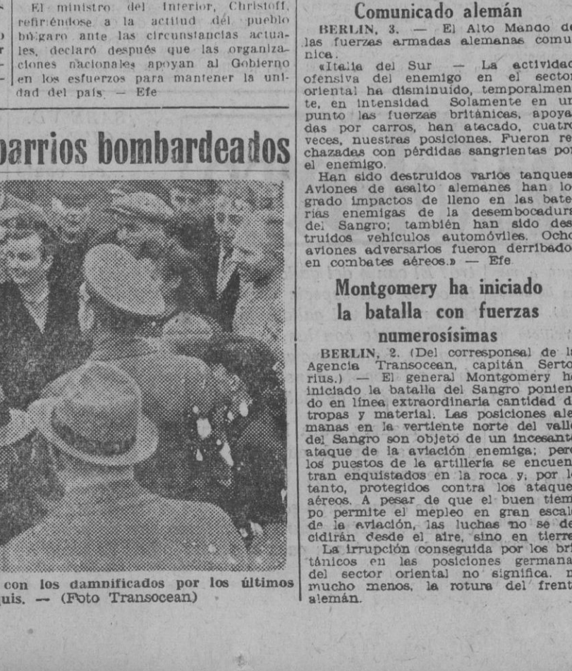
El mariscal Goering conversando con los damnificados por los últimos bombardeos angloyanquis.