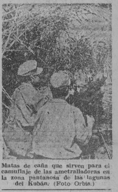
Matas de caña que sirven para el camuflaje de las ametralladoras en la zona pantanosa de las lagunas del Kubán.