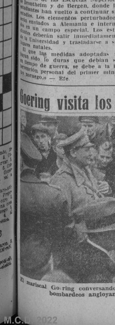
El mariscal Goering conversando con los damnificados por los últimos bombardeos angloyanquis.