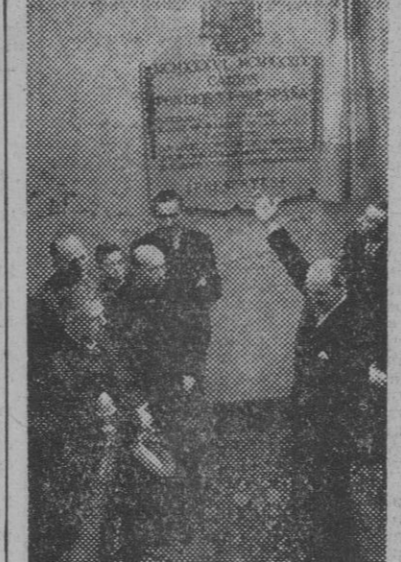
El presidente de las Cortes, don Esteban Bilbao, en el acto de descubrir una lápida con los nombres de los funcionarios de las Cortes, Caídos por Dios y por España.