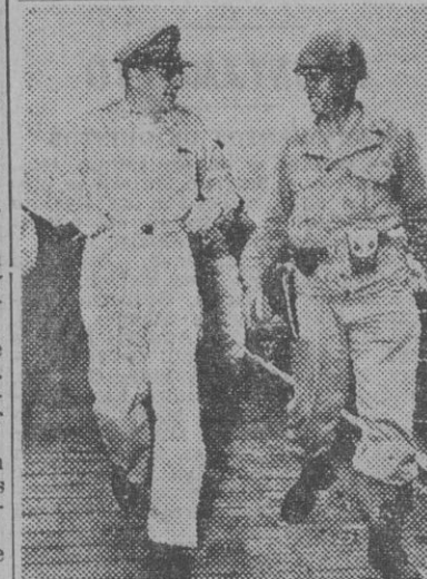
El general Douglas Mac Arthur, del Ejército norteamericano, con su adjudante, en una visita a una base americana del Pacífico