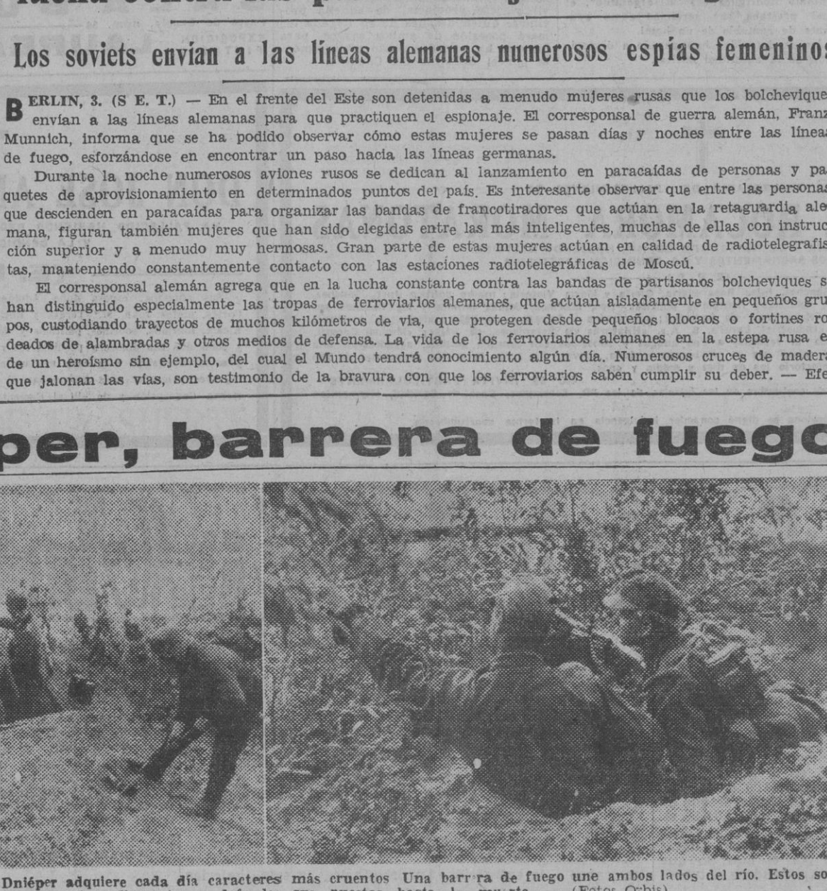
De una a otra orilla, la batalla del Dniéper adquiere cada día caracteres más cruentos. Una barrera de fuego en ambos lados del río. Estos soldados alemanes se parapetan dispuestos a defender sus puestos hasta la muerte.

LOS FONDOS DE LA OBRA «SOCORRO DE INVIERNO», ESTAN CASI AGOTADOS