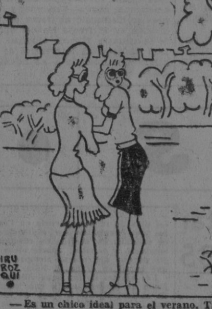
— Es un chico ideal para el verano. Tiene muy buena sombra.