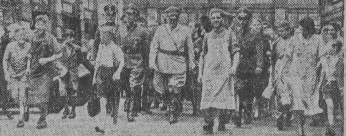
El mariscal del Reich, Hermann Goering, durante su visita al mercado central de Berlín, inspecciona los distintos departamentos.

La multitud ha aclamado al Generalísimo durante el trayecto desde el Pazo de Meirás