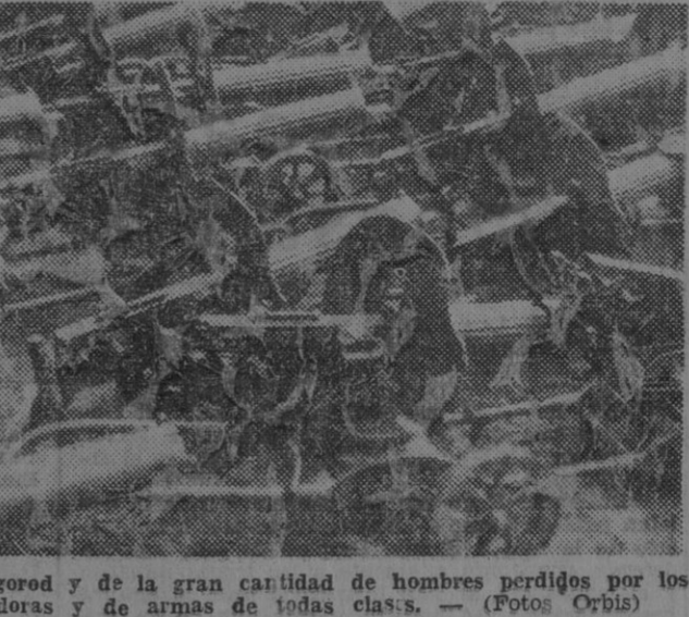
Aparte de los miles de tanques y aviones destruidos en la gran batalla de Bielgorod y de la gran cantidad de hombres perdidos por los rusos, han caído en manos de los alemanes grandes cantidades de ametralladoras y de armas de todas clases.