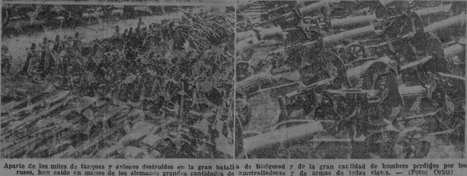
Aparte de los miles de tanques y aviones destruidos en la gran batalla de Bielgorod y de la gran cantidad de hombres perdidos por los rusos, han caído en manos de los alemanes grandes cantidades de ametralladoras y de armas de todas clases.