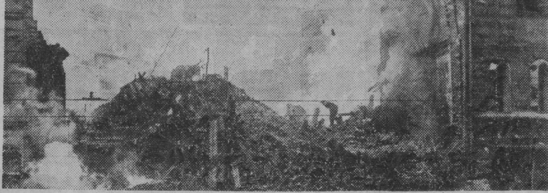
De acuerdo con las órdenes del Alto Mando inglés, los aviadores británicos descargaron nuevamente en su último ataque de terror contra Berlín, las bombas sobre las viviendas, monumentos artísticos y hospitales. La foto presenta una casa de la calle Graef destruida por una bomba explosiva.