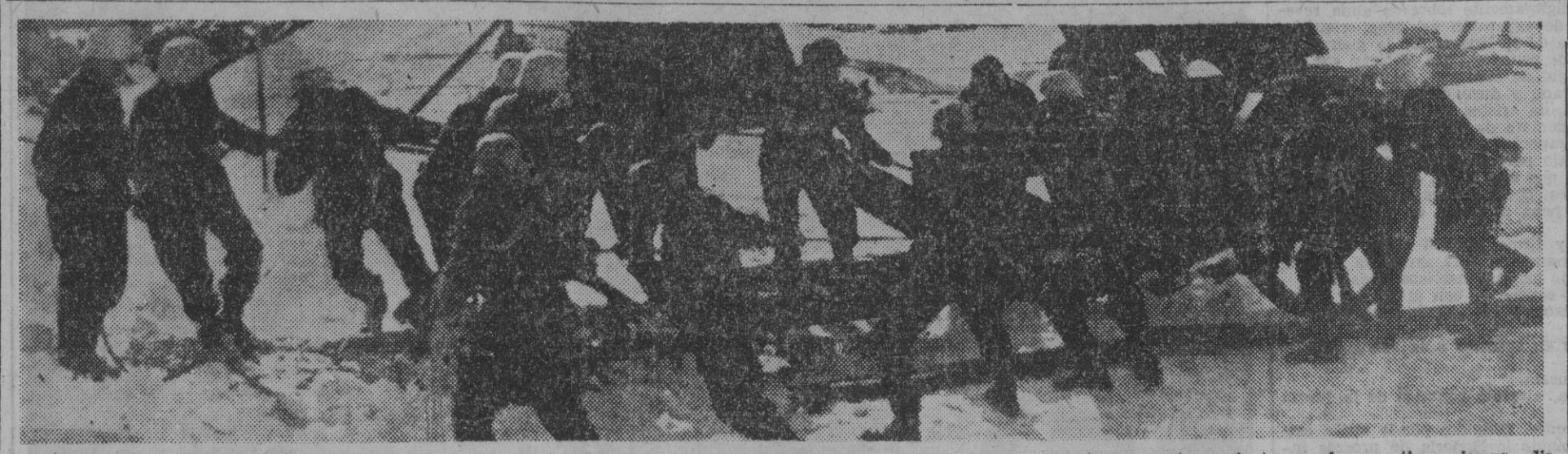
Para lograr un estado de verdadera eficacia en cualquier momento de necesidad, los artilleros alemanes se sometieron a un riguroso entrenamiento que los mantiene siempre dispuestos a cualquier evento. He aquí, en las inhóspitas orillas del Mar Glacial, un grupo de artillería haciendo prácticas de tiro.