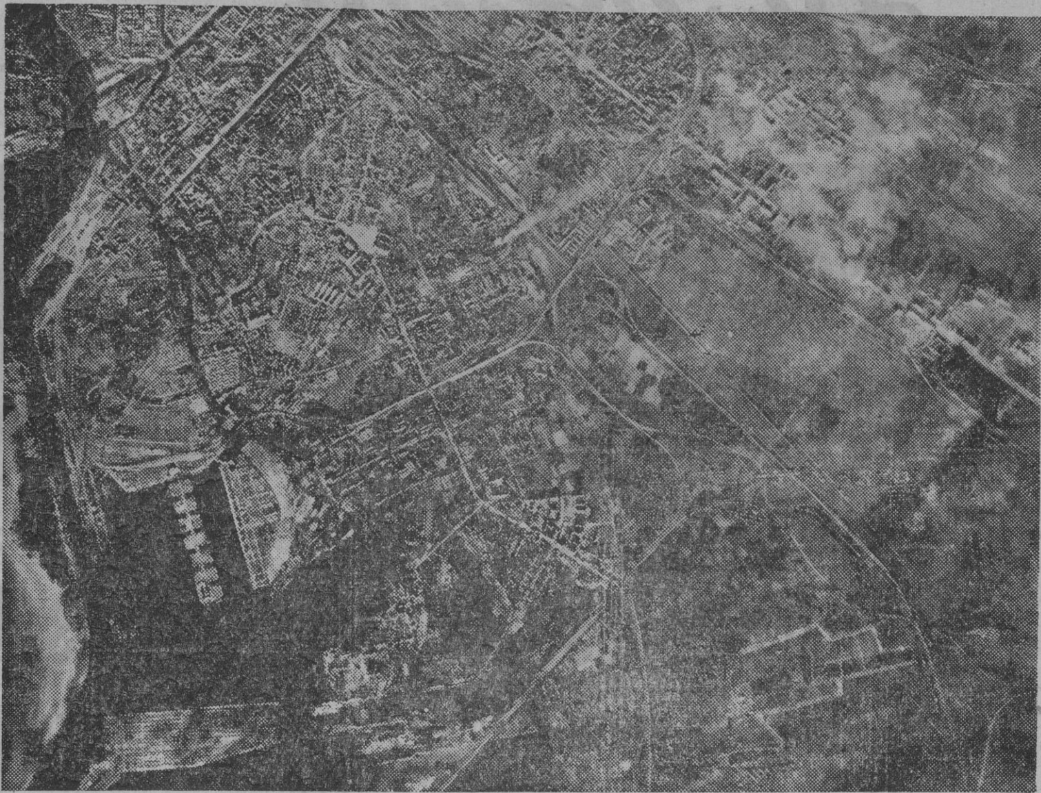
Plano de la ciudad de San Petersburgo (Leningrado), núcleo de resistencia soviética en el extremo noroeste del frente, sobre el que se concentra la lucha de hostigamiento aéreo y artillero de las fuerzas alemanas